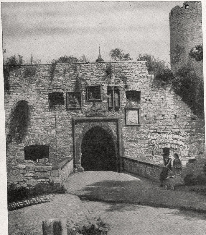
Abb. 12 Westtor der Burg Querfurt

Abgeschlossen November 1961. Dr. H. Spiegel und Arbeitskreis Bibliothek.