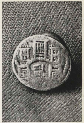
Silbermünze, Münzstelle Corvey, Abt Heinrich III. von Hornburg, 1272 bis 1306, Museum Höxter-Corvey.

Und die Gruppe der Veranstalter, der ureigentliche Auftraggeber, ist die Gruppe der Menschen, die an den Denkmälern persönlich oder durch Zuneigung interessiert sind, die Besitzer und die Burgenfreunde, die Burgenvereinigungen und andere historische Vereine. Sie stellen wieder besondere