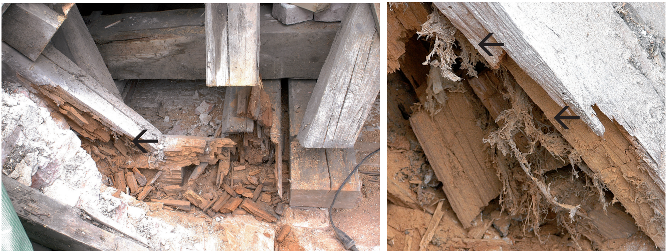
Abb. 6a. Der Detailausschnitt zeigt das abgestorbene Strangmyzel des Hausschwammes (schwarzer Pfeil).