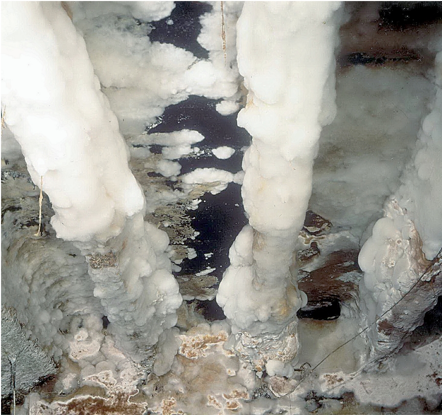
Abb. 1. Der Hausschwamm an einer Kellerdecke in Liverpool mit wattigem Myzel und Fruchtkörpern.

Schlaflose Nächte sind noch das geringste Übel, das den Eigentümer eines Schlosses oder einer Burg heimsucht, wenn in seinem Anwesen der Befall von Hausschwamm entdeckt wird. Hatte er nicht von anderen Fällen gehört, wo der Pilz zum finanziellen Bankrott geführt hatte? Mussten nicht komplette Gebäudeteile abgerissen werden, weil sie vom Pilz zerstört worden waren? Wird ihm nun Gleiches widerfahren?