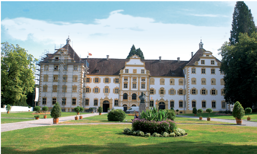
Abb. 5. Schloss Salem, Ansicht von wo der Parkseite.

nige Jahre lebend erhalten kann, wenn z. B. die Werte der Luftfeuchtigkeit unter 82 % gesunken sind und die Weiterentwicklung des Pilzes ausschließen, aber zum erneuten Aufleben des Hausschwammes durch das Auswachsen einzelner Hyphen aus dem Strang ist als unabdingbare Voraussetzung erforderlich, dass die umgebende Luft nicht in Bewegung ist und die Luftfeuchtigkeitswerte nahe der Sättigung liegen 17 .