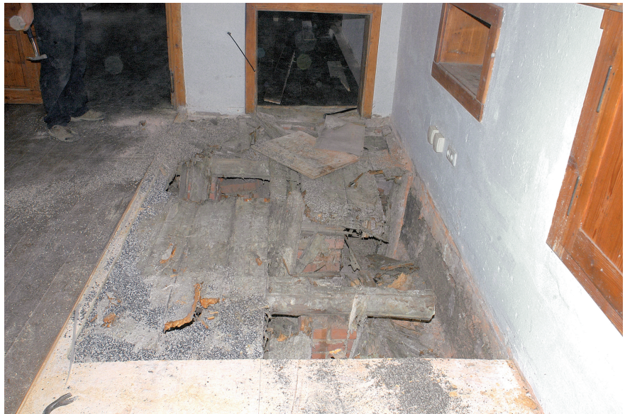
Abb. 7. Im Schloss Kaltenberg war in einem der Gebäude der Fußboden durchgebrochen. Es wurden die zerstörten Holzteile ersetzt, die Wände blieben unangetastet.

Der Befall von Holz in einem Gebäude ist andererseits immer möglich und sogar wahrscheinlich, wenn das Holz nass geworden ist. Dann ist der Befall unabhängig davon, ob das Holz