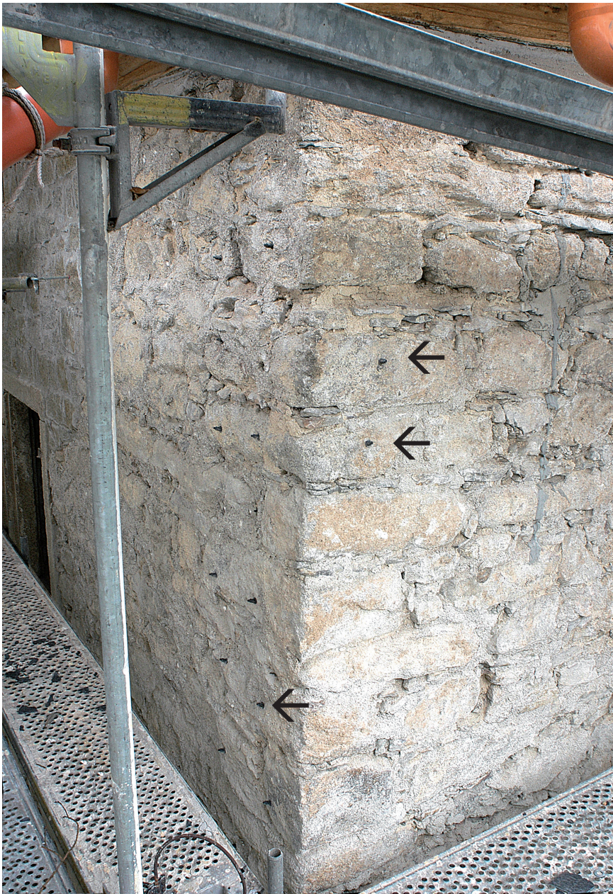
Abb. 10. Denkmalgeschütztes Schloss Kirchenlamitz. Geradezu schwachsinnig ist das Einpumpen giftiger Hausschwammbekämpfungsmittel in das Innere (!) von Granitsteinen (schwarze Pfeile).

eigentlichen Ernährungsgrundlage, dem Holz oder Holzwerkstoff, abgetrennt ist, stirbt er nach einiger Zeit ab, ohne noch irgendwo Schaden anrichten zu können. Falls ein Mauerwerk von Hausschwamm-Myzel oder -Strängen über- oder durchwachsen ist und in diesem Mauerwerk, was heutzutage meistens der Fall ist, keine konstruktiven Hölzer wie z. B. in einem Fachwerkhäuser vorhanden sind – was sich zerstörungsfrei mit entsprechenden Geräten ermitteln lässt –, dann sind weder weitere Untersuchungen des Mauerwerks noch eine chemisch bekämpfende Behandlung