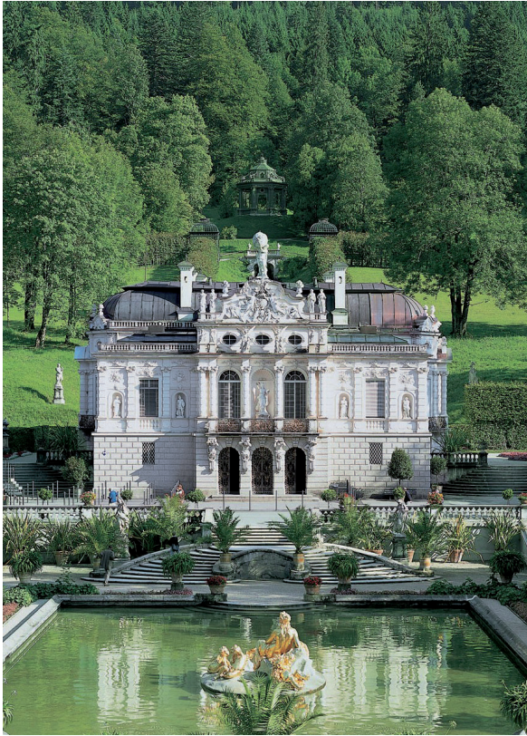
Abb. 8. Schloss Lindenhof. Im rückwärtigen Bereich der Venusgrotte waren verschiedene Schäden durch Pilze, hauptsächlich den Tannenblättling ( Gloeophyllum abietinum ), aufgetreten. Sanierungs- und Schutzmaßnahmen waren empfohlen worden.

Nach § 4.2.1 sind alle befallenen Holzteile ... ein ausreichendes Stück über den sichtbaren Befall hinaus zu entfernen, ... bei Echtem Hausschwamm und verwandten Hausschwammarten um mindestens 1 m in Längsrichtung der Hölzer.