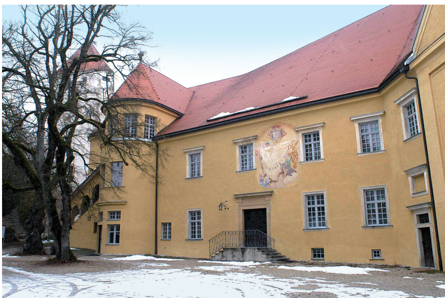
Abb. 3. Im Kellergewölbe der Burg Neuburg am Inn konnte der Hausschwamm-befall durch die Entfernung befallener Holzkisten und die korrekte Belüftung des Gewölbekellers beseitigt und zukünftig verhindert werden.

welche bei den Arbeitern an ihren Fußsohlen haften, ein bislang hausschwammfreies Gebäude befallen könnte.