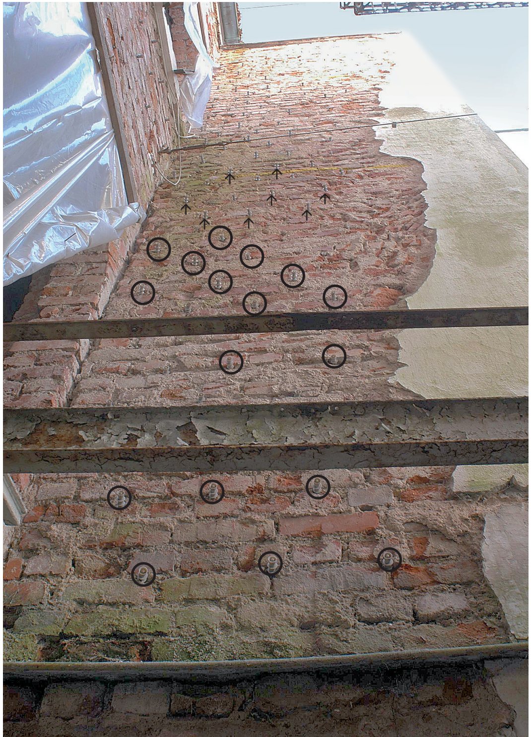
Abb. 9. Eine vollkommen sinnlos und überflüssig nach DIN 68800, Teil 4, mit etwa 100 Packern durchlöchernde und mit giftiger Chemie vollgepumpte Außenmauer der mehrgeschossigen Schumann-Villa in Arzberg. Die Packer dienen dazu, unter Druck chemische Gifte gegen das Myzel des Hausschwammes in das Mauerwerk zu pressen. Die schwarzen Kreise und Pfeile zeigen beispielhaft einige dieser Packer.

letzten erkennbaren Pilzmyzel erstrecken.