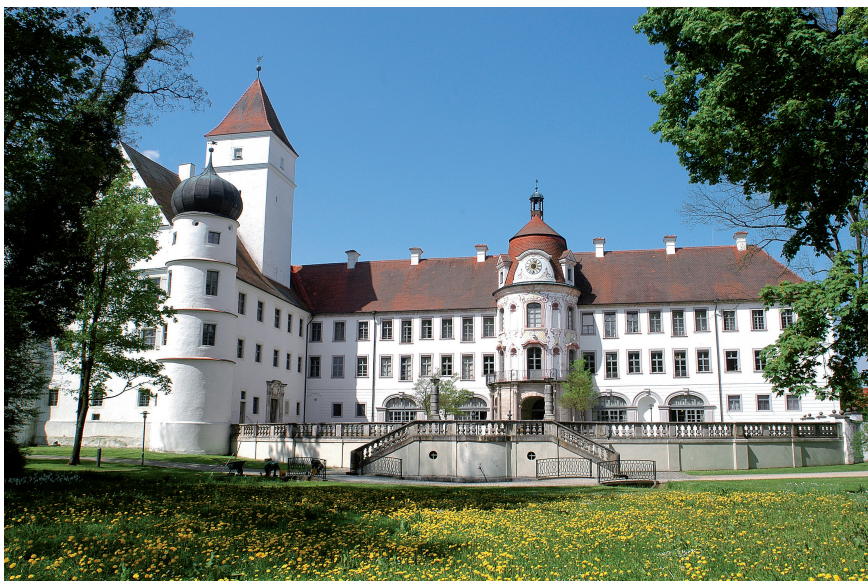
Abb. 2. Im Schloss Alteglofsheim war bei der Sanierung Hausschwammbefall im Fußboden des Asamsaales entdeckt worden, welcher sich mit minimalen Eingriffen in die Holzsubstanz und unter Einsatz des ungiftigen Holzschutzmittels „wood-bliss“ behandeln ließ.

auch Glasflächen. Auch in der Ausbildung seiner Fruchtkörper ist er äußerst anpassungsfähig und bildet je nach Gegebenheit flache Überzüge, knotige Auswüchse oder waagrecht abstehende Hüte. Auf den Fruchtkörpern werden die Hymenien (= Fruchtschichten) gebildet, welche die Basidien (= Sporenträger) und auf diesen die Sporen in kaum vorstellbaren Mengen produzieren. Oft bedecken die von der Luft fortgetragenen Sporen sämtliche Oberflächen in einem Gebäude, Fußböden, Möbel und alle