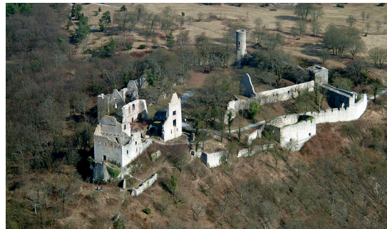
Burgruine Homburg in Unterfranken, Luftaufnahme.