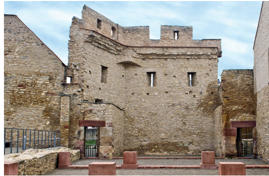
Ingelheim, Kaiserpfalz. Heidesheimer Tor, Innenansicht nach der Sanierung 2007 (Foto: Holger Grewe).