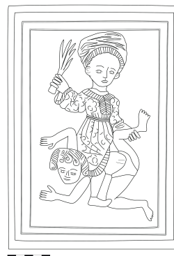
Ofenkachel aus der Burg Čabrad', Aristoteles und Phyllis.