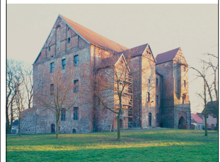
Veröffentlichungen der Deutschen Burgenvereinigung Reihe A: Forschungen, Band 10

Adelssitze zwischen Elbe und Oder 1400 – 1600