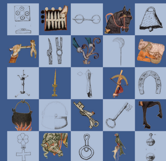
Veröffentlichungen der Deutschen Burgenvereinigung Reihe A: Forschungen, Band 11

Tric-Trac, Trense, Treichel Untersuchungen zur Sachkultur des Adels im 13. und 14. Jahrhundert