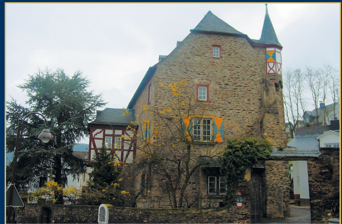
Mustersaniertes Burghaus nahe Koblenz zu vermieten