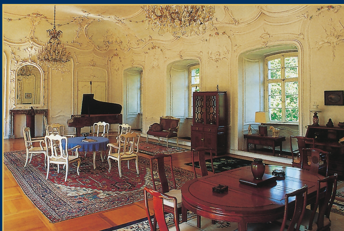
Schloss in Franken mit wertvoller Bauornamentik