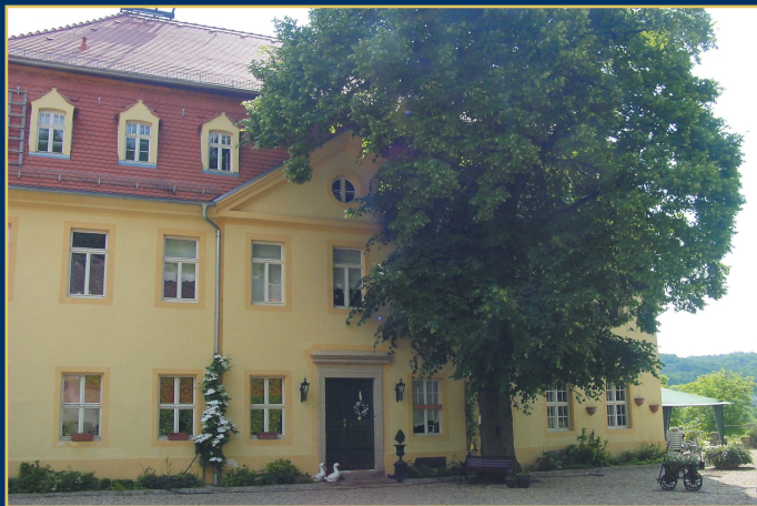
Barockes Gutshaus mit abgeschlossener Eigenjagd und 2,5 km langem Elbufer in Sachsen