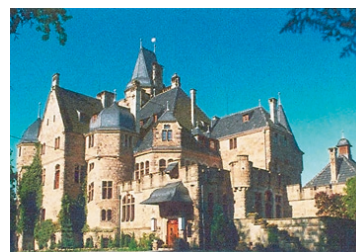
Jagdschloss in Hessen € 780.000,-

Ca 40.000 m 2 Grundst., ca 1.000 m 2 Wfl. € 780.000,- incl. Inventar, Top-Zustand. Mögliche, höchst lukrative Kapitalanlage bei Aufteilung nach WEG (z.B. in 5 Eigentumswohnungen à 200.000,- €). Dies geht auch bei allen weiteren 20 Burgen u. Schlössern , die wir z.Zt. zu vermitteln haben. Bitte schauen Sie einmal bei www.spezialimmobilien.de rein. Wir helfen Ihnen auch bei der Marktwertermittlung. Spezialimmobilien Heinz Tel. 02263-72244