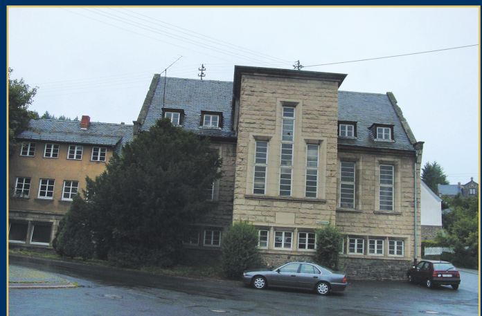
Expressionistischer Bau in der Eifel nahe Bonn