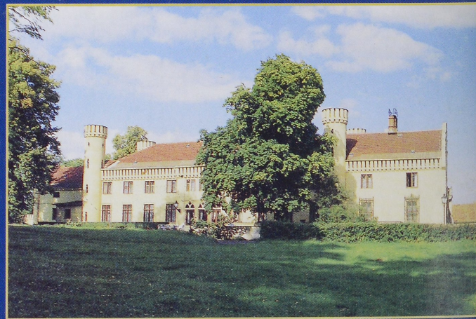
Schloss bei Potsdam