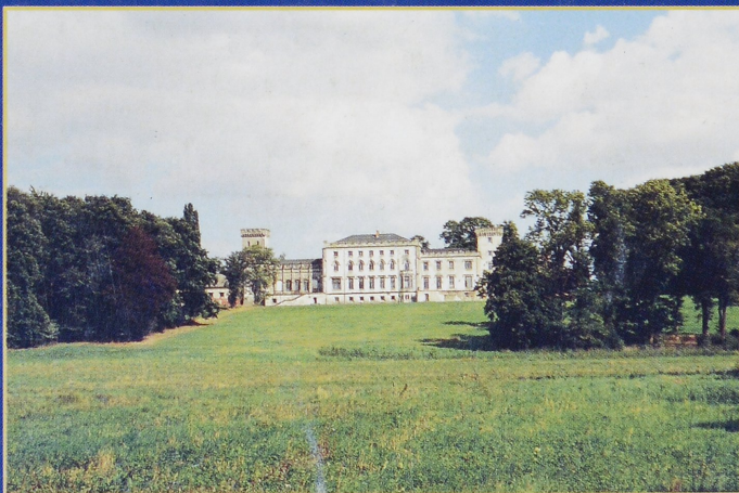
Schloss in Mecklenburg-Vorpommern