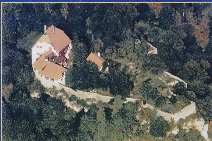
Burg in Franken