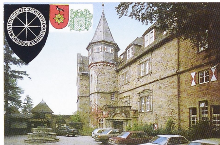
Burg-Hotel mit Restaurant DM 3,9 Mio. VHB

Wir haben z. Zt. ca. 50 exklusive Liegenschaften von DM 400 000,- bis DM 12 Mio. zu vermitteln.