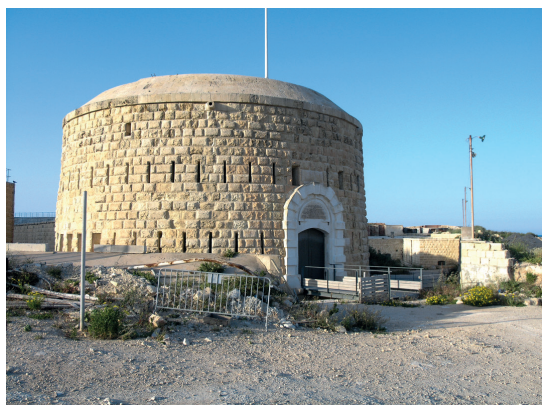
Sliema (Malta), Fort Tigné, 1792/1795. Das Kernwerk („Donjon“) in Form eines Turmforts mit rustiziertem Mauerwerk.