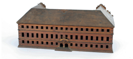
Modell zur Marienburg in Ichtershausen, Garten- seite (Stiftung Schloss Friedenstein, Gotha).