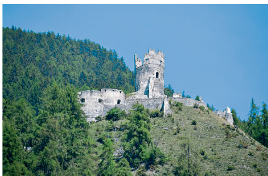
Castel Rotund (Oberrei- chenberg) bei Taufers in Südtirol.