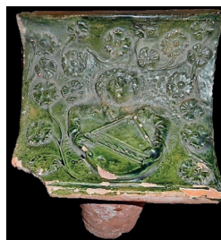
Blatt einer Gesimskachel. Das Motiv zeigt einen Schildknappen mit einem Wappencollier. Das Wappen wird dem Landgrafen von Niederelsass zugeschrieben.