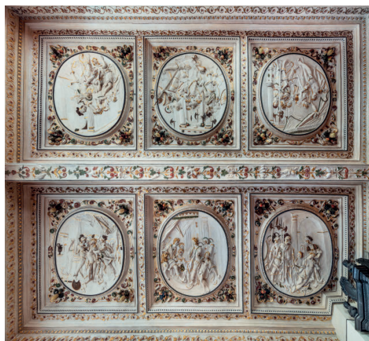
Schloss Weikersheim. Die stuckierte Decke des Georg-Friedrich-Zimmers mit sechs Bildern von Frauen aus der römischen Geschichte.