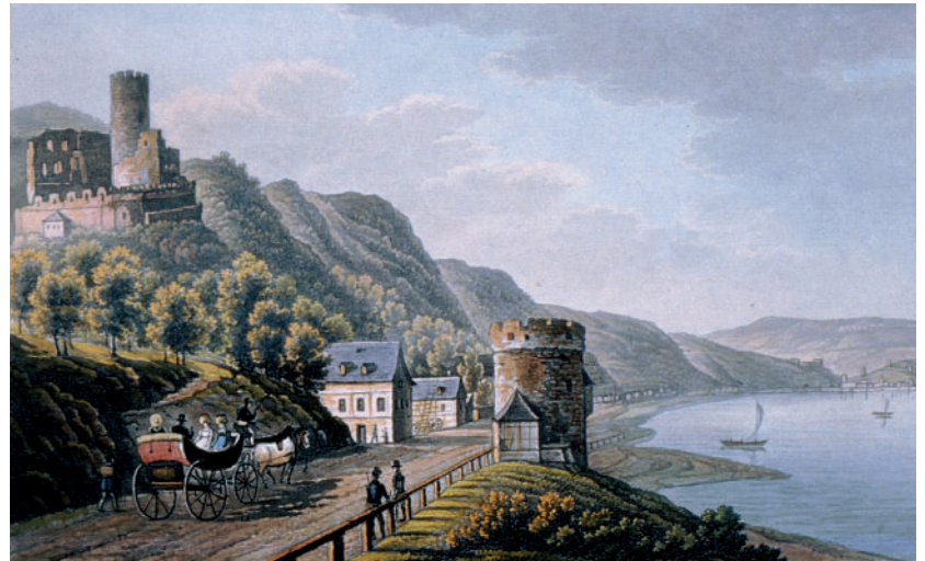
Rheindiebach, südlicher Ortseingang mit Tor und Turm. Altkolorierte Aquaretta von R. Bodmer nach J. A. Lasinsky (aus dem Rheinalbum »VUES DU BORDS DU RHIN«, Coblenz, um 1832).

Titelbild: Schloss Weikersheim, Rittersaal.