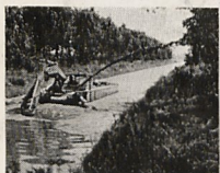
Bürstenkopf-Saugbagger mit Schlammauswurf oder mit schwimmenden Leitungen.

Nutzen Sie die Konijn-Nassbagger-Technik zur Lösung Ihrer Gewässer-Probleme! Komplett.