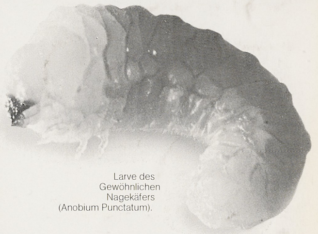
Larve des Gewöhnlichen Nagekäfers (Anobium punctatum).