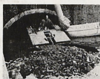
Kleine Schubboote baggern Gewölbe und Abzugskanäle.

Konijn kommt mit neuer Gewässer- Reinigungs- Technik.