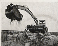
Unsere Amphibieschlepper arbeiten optimal in flachen und untiefen Gewässern.