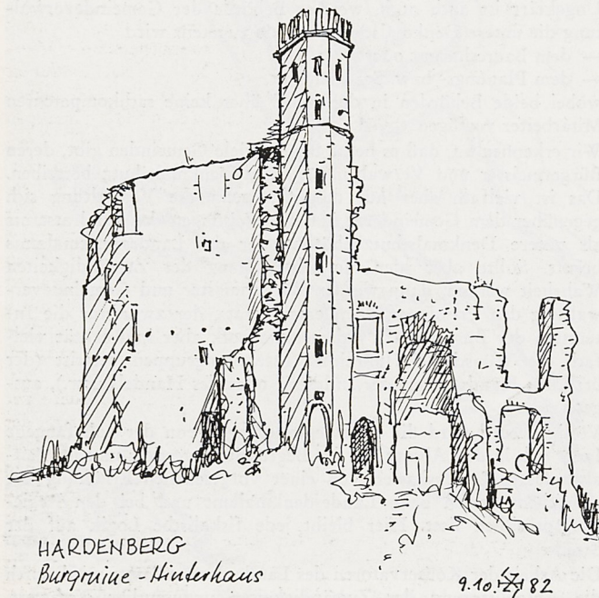
HARDENBERG Burgruine - Hinderhaus