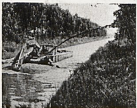
Bürstenkopf-Saugbagger mit Schlammauswurf oder mit schwimmenden Leitungen.

Nutzen Sie die Konijn-Nassbagger-Technik zur Lösung Ihrer Gewässer-Probleme! Komplett.