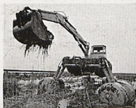
Unsere Amphibidredges arbeiten optimal in flachen und untiefen Gewässern.