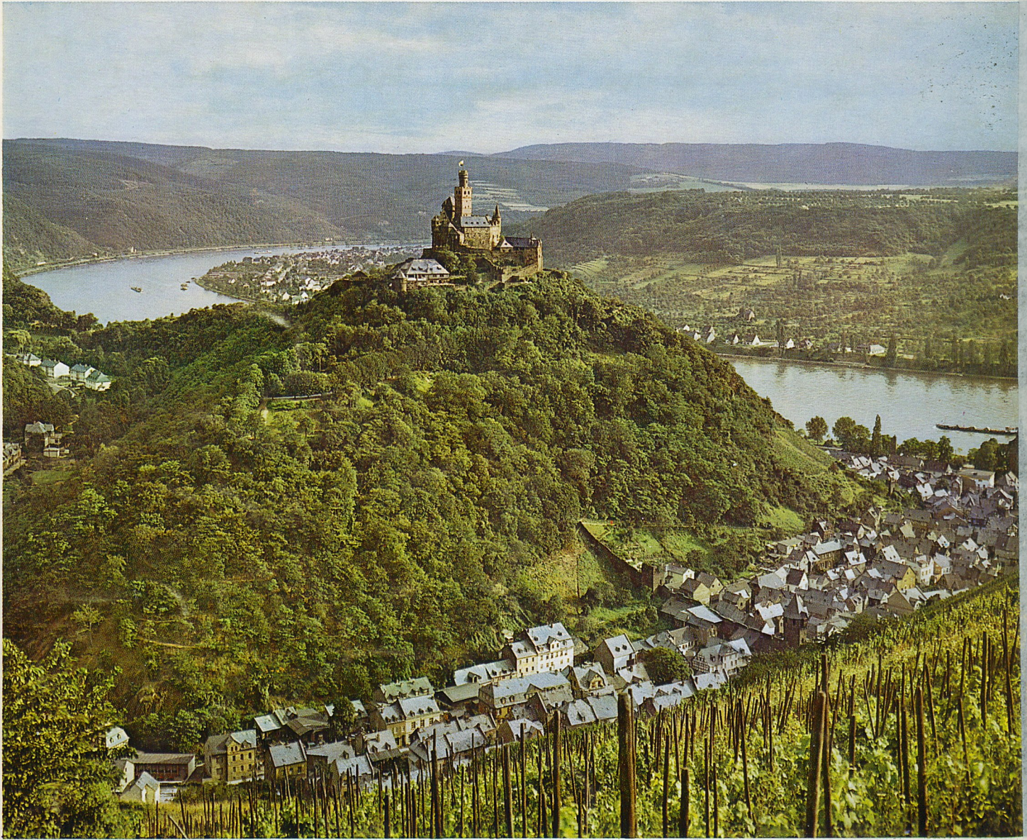
Die Marksburg über Braubach/Rhein

setzt sich für die Erhaltung aller historischen Profanbauten als Denkmäler der Kunst, als Zeugnisse der Geschichte und Kultur und als landschaftsgestaltende Faktoren ein, fördert die Erforschung der historischen Bauwerke und die Verbreitung der Forschungsergebnisse durch die Zeitschrift „Burgen und Schlösser“ u. a. Veröffentlichungen.