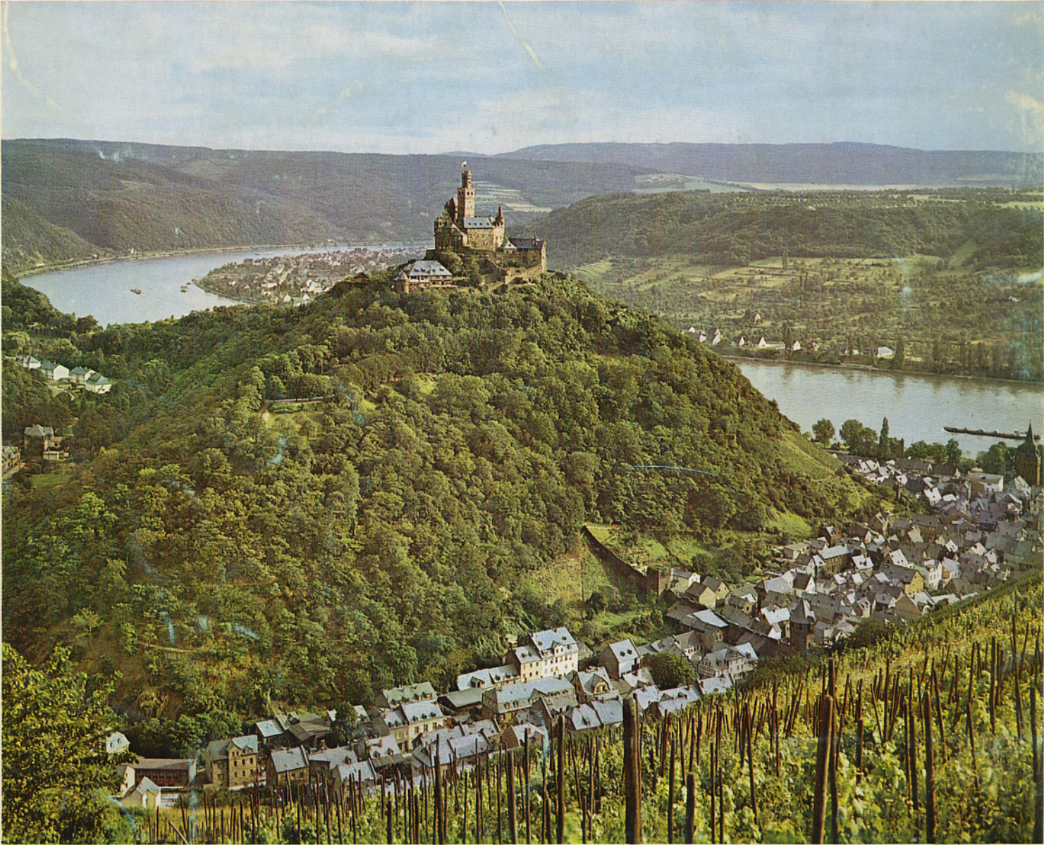
Die Marksburg über Braubach/Rhein

setzt sich für die Erhaltung aller historischen Profanbauten als Denkmäler der Kunst, als Zeugnisse der Geschichte und Kultur und als landschaftsgestaltende Faktoren ein, fördert die Erforschung der historischen Bauwerke und die Verbreitung der Forschungsergebnisse durch die Zeitschrift „Burgen und Schlösser“ u. a. Veröffentlichungen.