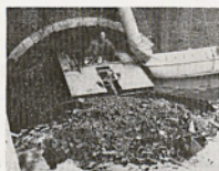
Kleine Schubboote baggern Gewölbe und Abzugskanäle.

Konijn kommt mit neuer Gewässer- Reinigungs- Technik.