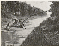
Bürstenkopf-Saugbagger mit Schlammauswurf oder mit schwimmenden Leitungen.

Nutzen Sie die Konijn-Nassbagger-Technik zur Lösung Ihrer Gewässer-Probleme! Komplet.