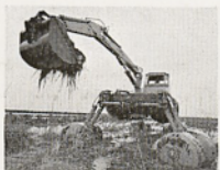
Unsere Amphibious-Dredges arbeiten optimal in flachen und untiefen Gewässern.