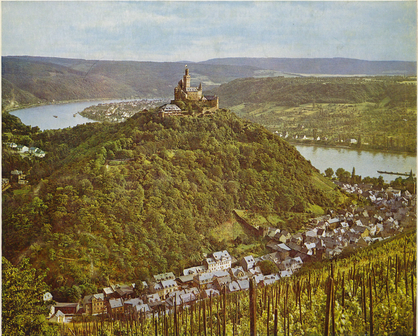
Die Marksburg über Braubach/Rhein

setzt sich für die Erhaltung aller historischen Profanbauten als Denkmäler der Kunst, als Zeugnisse der Geschichte und Kultur und als landschaftsgestaltende Faktoren ein, fördert die Erforschung der historischen Bauwerke und die Verbreitung der Forschungsergebnisse durch die Zeitschrift „Burgen und Schlösser“ u. a. Veröffentlichungen.