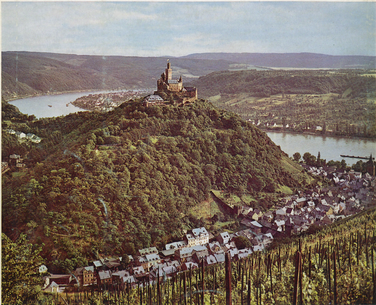
Die Marksburg über Braubach/Rhein

setzt sich für die Erhaltung aller historischen Profanbauten als Denkmäler der Kunst, als Zeugnisse der Geschichte und Kultur und als landschaftsgestaltende Faktoren ein, fördert die Erforschung der historischen Bauwerke und die Verbreitung der Forschungsergebnisse durch die Zeitschrift „Burgen und Schlösser“ u. a. Veröffentlichungen.