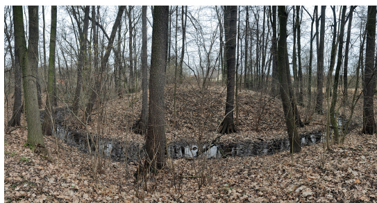
Turmhügelburg Muckerau (Mokra), Nieder- schlesien (Foto: Dominik Nowakowski, 2013).