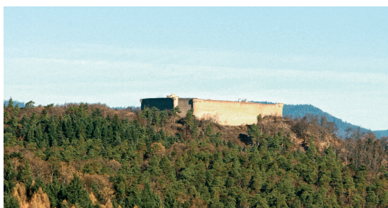
Burg Hohlandsberg im Elsaß, Ansicht von Süden (Foto: Guillaume Seiller, 2016).