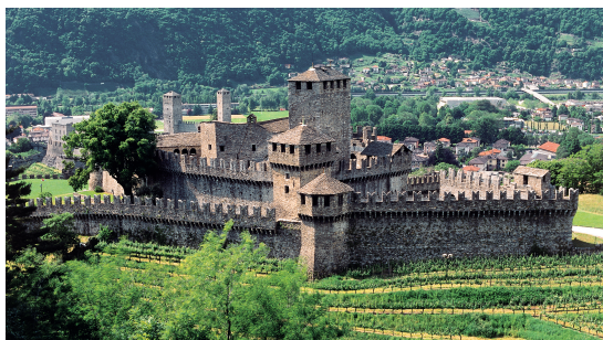
Bellinzona, Castello Montebello.