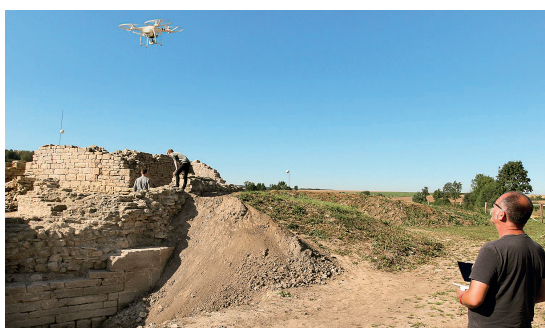
Ausgrabungen an der 1294 zerstörten Niederungsburg Holsterburg. Grabungstechniker Rudolf Klostermann dokumentiert mit der Drohne den 3-D-Scan.