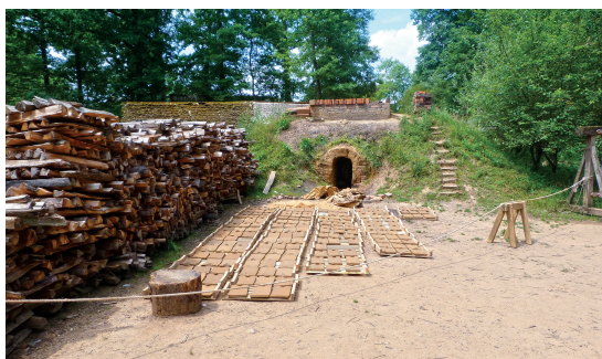
Burgenbaustelle Guédelon, Frankreich, Herstellung aller Baumaterialien wie im Mittelalter – hier Ziegelbrennerei (Foto: H. Holdorf, 2017).

Titelbild: Henri Lebert, Vue du Hohlandsbourg , 1833 (Original: Musée Unterlinden, Colmar; Foto: Ji-Elle; Wikimedia Commons, lizenziert unter Creative Commons Attribution-Share Alike 3.0 Unported; URL https://upload.wikimedia.org/wikipedia/commons/1/1e/Lebert_Henri-Vue_du_Haut-Landsbourg.jpg ).