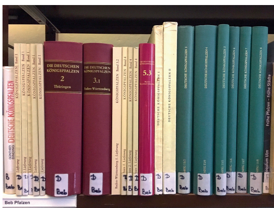
Publikationen aus dem Projekt „Repertorium der deutschen Königspfalzen“ in der Bibliothek des Europäischen Burgenin- stituts.