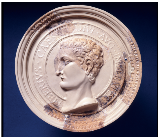
Teilergänztes Kaisermedail- lon mit dem Portrait des Tiberius. Durchmes- ser 0,40 m.