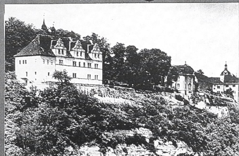
Bruno J. Sobotka/Jürgen Strauß Theiss

Viele von ihnen sind durch den Lauf der Geschichte schwer gezeichnet, verfallen oder durch rücksichtslose Fehlnutzung ramponiert. So richtet sich der Blick der begleitenden aktuellen Beiträge aus der Feder von Betroffenen nicht nur in die Vergangenheit, sondern auch in die Zukunft: Die Bestandsaufnahme des 40 Jahre lang vernachlässigten reichen Kulturbesitzes macht deutlich, daß für seine Rettung keine Kraftanstrengung zu groß sein darf.