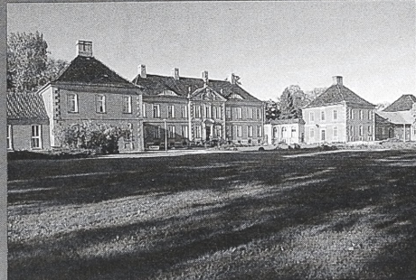
Bruno J. Sobotka/Jürgen Strauß Theiss

350 Seiten mit 60 Fotos, davon 25 in Farbe, sowie 39 historischen Ansichten, 26 Grundrissen und einer Übersichtskarte. DM 44,-.