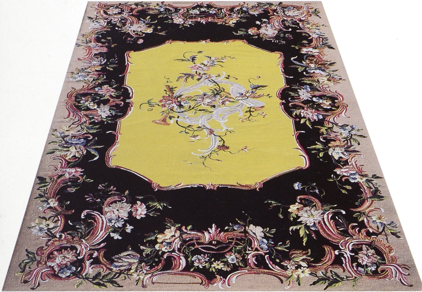
Kopie einer Fußtapete aus der Zeit Friedrichs II. der Manufaktur Charles Vignés Berlin um 1765 für Schlösser u. Gärten Sanssouci

Als Manufaktur fertigen wir Kopien nach historischen Vorlagen sowie moderne Gobelins, Savonnerieteppiche, Applikationsstickereien, Stickereien, Fahnen. Gewebe in verschiedenen Webtechniken. Darüber hinaus führt die Manufaktur Restaurierungsarbeiten von Tapisserien und Stickereien aus.