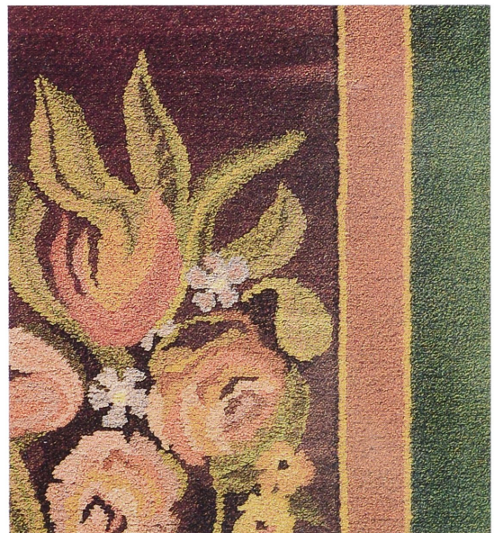
Ausschnitt Bodenteppich – Savonnerie

Textilmanufaktur Halle Puschkinstraße 19 O-4020 Halle/Saale Tel. 24934 · Fax 24935