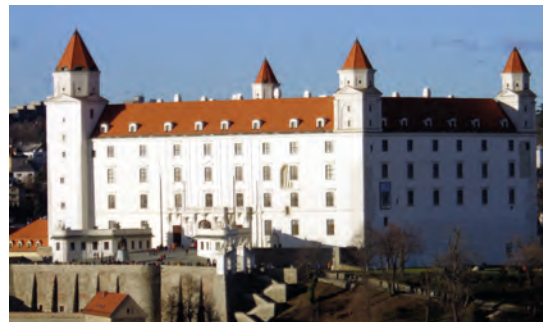
Die Burg von Pressburg.