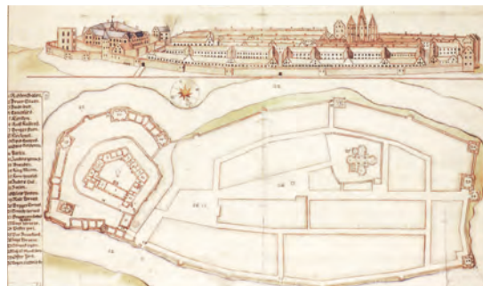
Festung Kalundborg auf einer Ansicht aus dem 17. Jahrhundert (Nationalmuseum Kopenhagen).