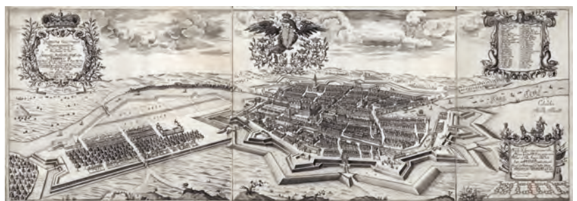
Berlin, links die Dorotheenstadt. Vogelschau von Johann Bernhard Schultz, 1688 (Staatsbibliothek zu Berlin – PK; http://resolver.staatsbibliothek-berlin.de/SBB00003D5D00000000 ).