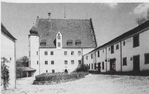
Abb. 2. Schloss Eggersberg vor und nach der Wiederherstellung.