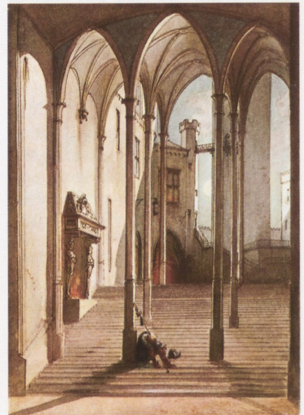
Abb. 1. Stolzenfels, die Säulenhalle. Aquarell von Caspar Scheuren, um 1845.

Unter dem Titel „Märchenschloss am Rhein. Impressionen von Schloss Stolzenfels“ präsentieren Burgen, Schlösser, Altertümer Rheinland-Pfalz, die Landesmuseen Koblenz und Mainz und die Rheinische Landesbibliothek in der Villa Ludwigshöhe in Edenkoben Aquarelle des Düsseldorfer Künstlers Caspar Scheuren (1810 bis 1887). Zu sehen sind Impressionen von Schloss Stolzenfels und der landschaftlichen Umgebung. Bereits 1840 hatte der Düsseldorfer Maler Caspar Scheuren vom preussischen Hof den Auftrag erhalten, Schloss Stolzenfels in einer Serie von Aquarellen festzuhalten. Während mehrerer Aufenthalte führte er den Auftrag durch, so dass sich die Entstehung des romantischen Umbaus des Schlosses in verschiedenen Stadien nachvollziehen lässt. So sind nicht nur die Innenräume des Schlosses in detaillierten Bildern festgehalten, sondern in seltenen Blättern auch nicht ausgeführte Planungsphasen des