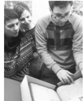
Lyon: Besuch der Stadtbibliothek Visite de la bibliothèque municipale de Lyon