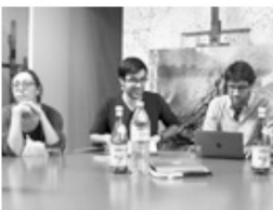
Besuch der Stipendiaten in der Fondation Hartung-Bergman in Antibes Retraite des boursiers à la Fondation Hartung-Bergman à Antibes