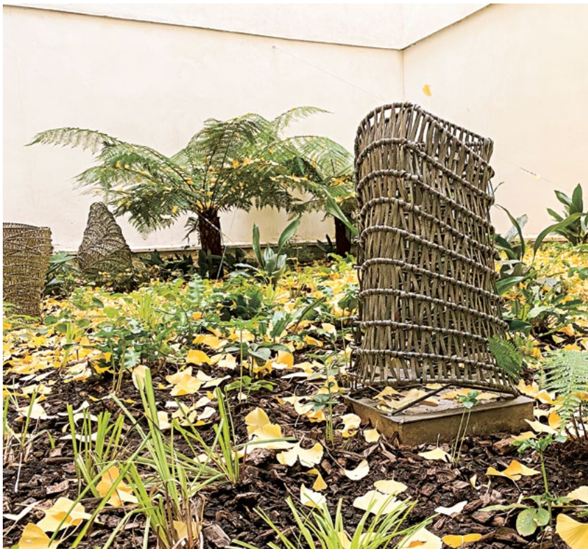
Abb. 4 Korbskulpturen im Patio des DFK Paris von Stéphanie Buttier, © Stéphanie Buttier Fig. 4 Sculptures de Stéphanie Buttier dans le patio du DFK Paris, © Stéphanie Buttier