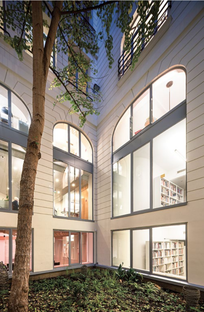
Abb. 1-2 Patio des DFK Paris, © Patrick Tourneboeuf / DFK Paris Fig. 1-2 Patio du DFK Paris, © Patrick Tourneboeuf / DFK Paris