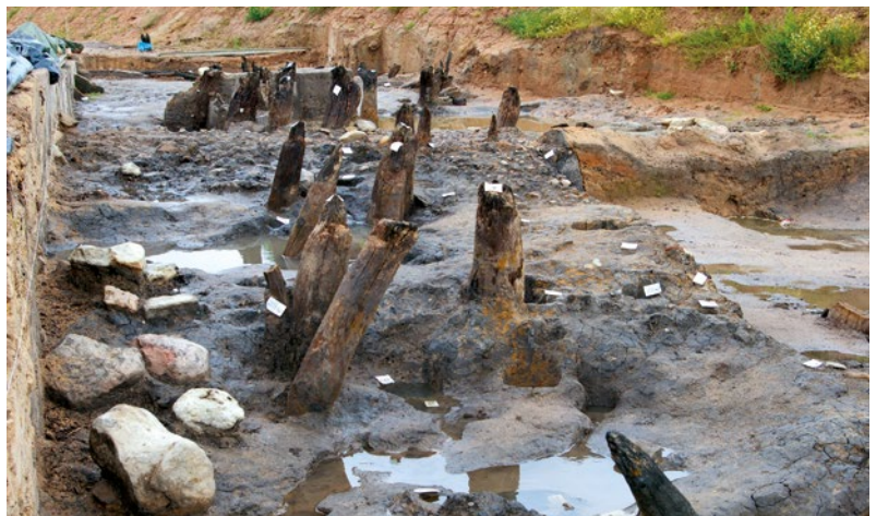
Abb. 3: Rekonstruierter germanischer Rennofen Verhüttungsversuch beim Hesttag 2012 in Wetzlar (Lahn-Dill-Kreis)