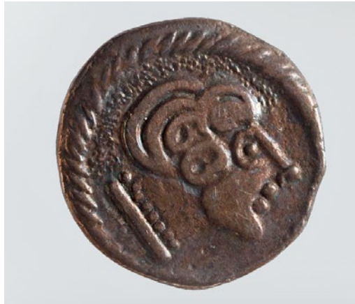
Abb. 7: Das Kelten-Land-Hessen-Logo und sein Vorbild

Das hessische Fundmaterial dieser acht vorchristlichen Jahrhunderte erlaubt es, in den Ausstellungen mehrere Erzählstränge aufzugreifen. Am bemerkenswertesten ist die Geschichte des neuen Werkstoffes Eisen, der in der Hallstattzeit zuerst nur für wenige, von den Eliten benutzte Gegenstände, vor allem für Schwerter, Pferdetransport und Schlachtmesser, verwendet wurde, bevor in der Latènezeit in Landwirtschaft und Handwerk neue, bis heute verwendete und die technische und wirtschaftliche Entwicklung maßgeblich beeinflussende Geräte entwickelt wurden. Dazu zählen Pflugschar, Sense, Bügelschere oder Löffelbohrer. Sie sind darüber hinaus Zeugen einer massiven Effizienzsteigerung. Durch den regionalen Abbau von Eisenerz, dessen Verhüttung und einer Eisenproduktion in fast schon industriellem Ausmaß im Hintertaunus und im Lahn-Dill-Gebiet stieg die Verfügbarkeit von Eisenobjekten im Laufe der Eisenzeit exponentiell an.