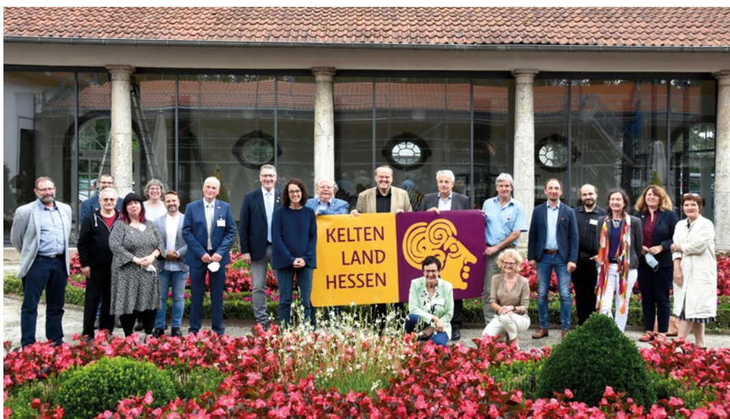
Abb. 12: Kick-off des Themenjahres »KELTEN LAND HESSEN 2022« Pressetermin mit Projektbeteiligten und der Ministerin für Wissenschaft und Kunst Angela Dorn

KELTEN LAND HESSEN – Archäologische Spuren im Herzen Europas. Hrsg. von Archäologisches Landesmuseum Keltenwelt am Glauberg, Archäologisches Museum Frankfurt, Vonderau Museum Fulda (Glauberg-Schriften 3 = Vonderau Museum Fulda – Kataloge 51 = Archäologisches Museum Frankfurt – Publikationen 5) (in Vorbereitung).