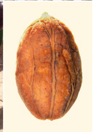
Abb. 7: Feigen, Oliven und Pinienkerne

wurden aus dem Mittelmeerraum von den Römern nach Hessen gebracht.