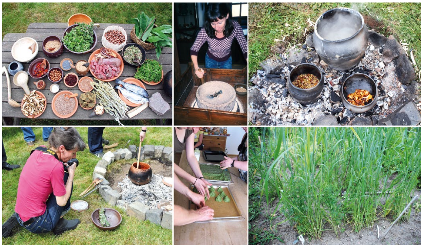
Abb. 2: Praktische Versuche führen zu wichtigen Erkenntnissen, z. B. beim Kochen an offenen Feuerstellen.

Fleiß der Menschen an. Allerdings war stets eine umfangreiche Vorausplanung erforderlich: So mussten z. B. in unseren Breiten die Vorbereitungen für die Versorgung im nächsten Winter beginnen, sobald der letzte Winter zu Ende war.