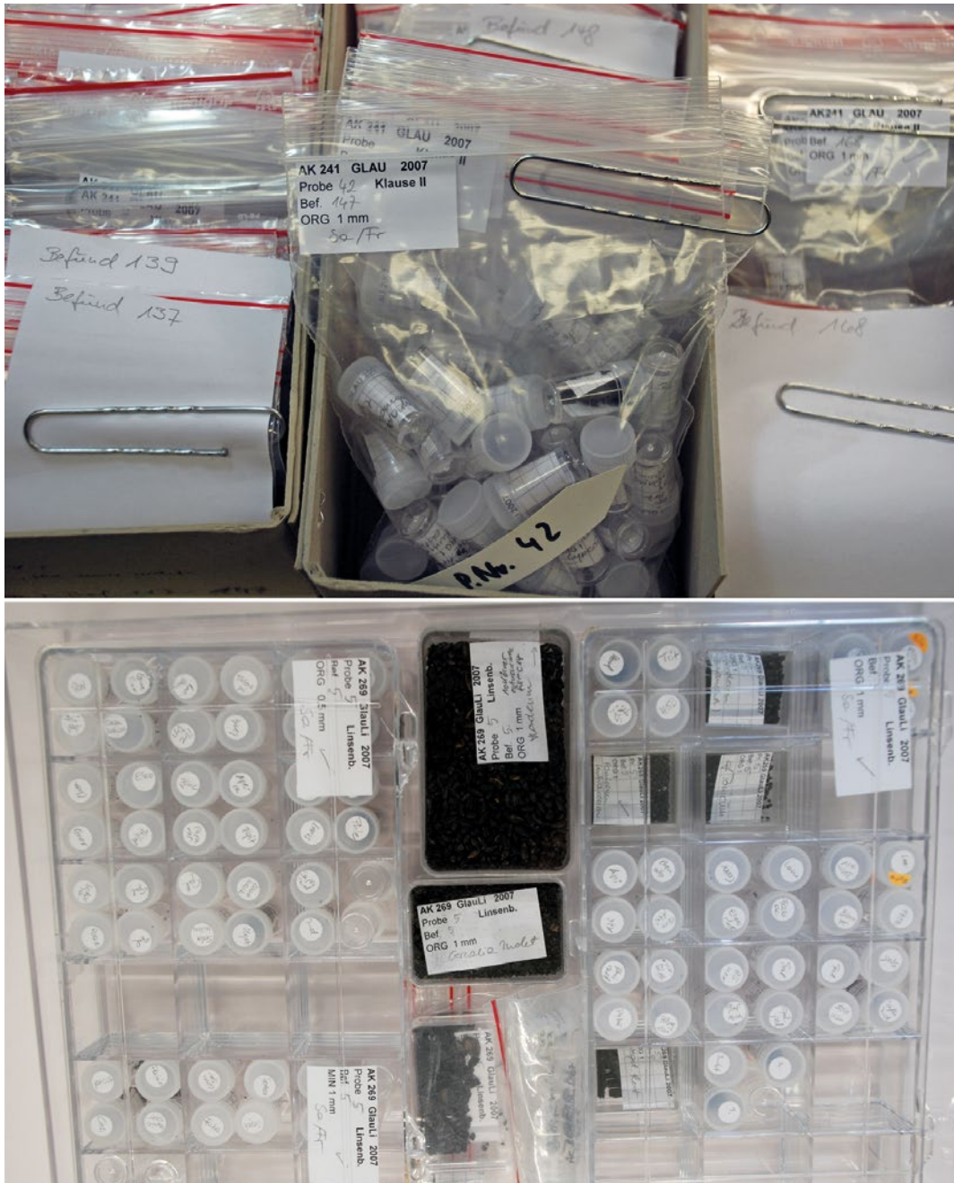
Abb. 5: Pflanzliche und andere Funde

werden unter dem Mikroskop aussortiert und nach Arten sepa- riert aufbewahrt.