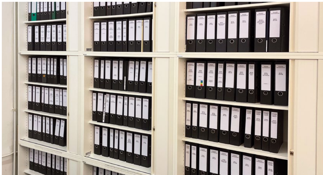
Abb. 9: Archäobotanische Ortsakten

Zusätzlich zur digitalen Datenspeicherung sind die Ergebnisse in Papierform in den archäobotanischen Ortsakten nach Fundstellen getrennt abgelegt.