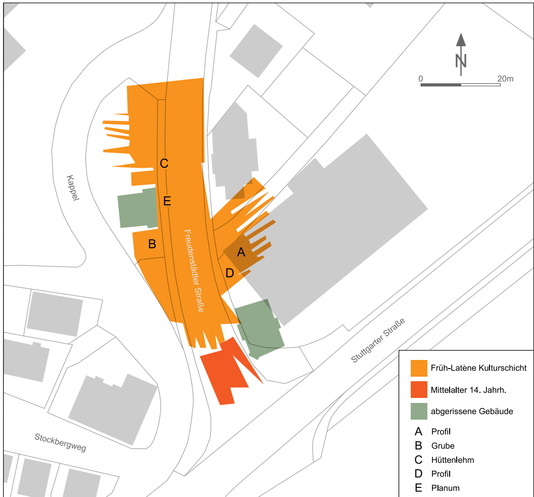
Abb. 7: Sulz am Neckar (Lkr. Rottweil) Fdst. 1.

Das Gelände steigt hier an der linken Talseite zunächst flach, dann ab dem Krankenhaus steil zur Hochfläche an. Ca. 100 m südwestlich der Baustelle verläuft die Römerstraße vom Kastell Sulz her durch die Talau und weiter durch einen tiefen Geländeeinschnitt zur Hochfläche und dann zum Kastell Waldmössingen.