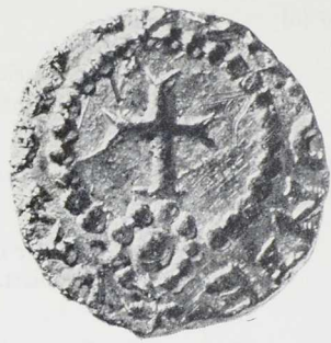
Abb. 194 Bietigheim (Lkr. Ludwigsburg). Triens des 7. Jahrhunderts, Monetar Dacoaldus. Maßstab 3 : 1.