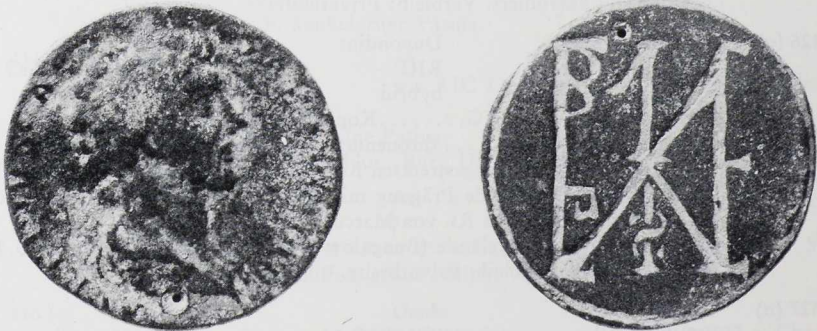
Abb. 196 Möckmühl (Lkr. Heilbronn). Sesterz des Antoninus Pius für Marcus Aurelius. Maßstab 2 : 1.