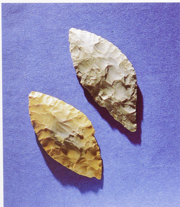
Abb. 3 Die Blattspitzen von der Haldensteinhöhle zum Vergleich.