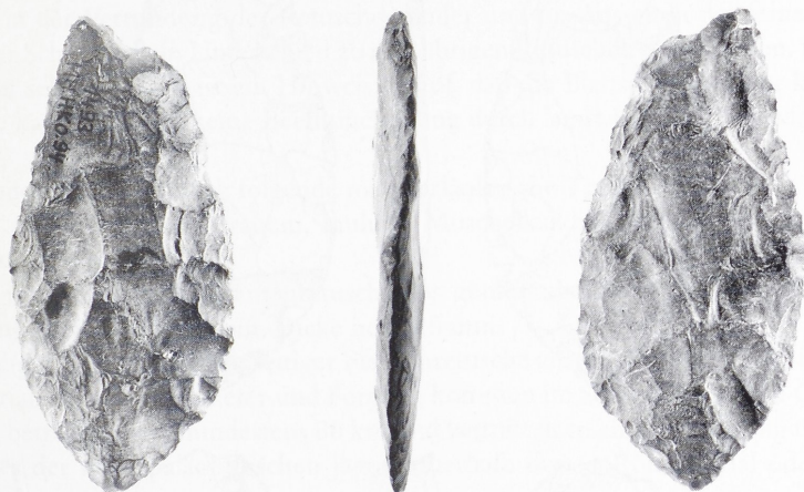
Abb. 2 Die mittelpaläolithische Blattspitze von Mundelsheim. M 2:3.