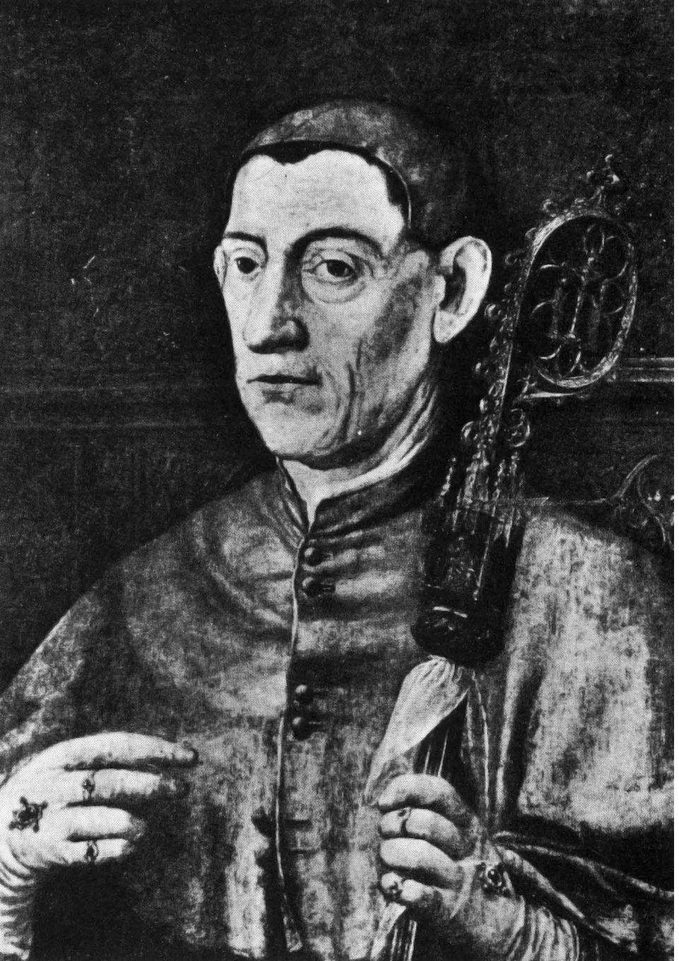
Figure 2: Anonyme, Portrait du soi-disant cardinal Jean de Baviere, XVI e siecle?, Espagne, collection privee non localisee (© d apres Elisa Bermejo Martinez, 1980).