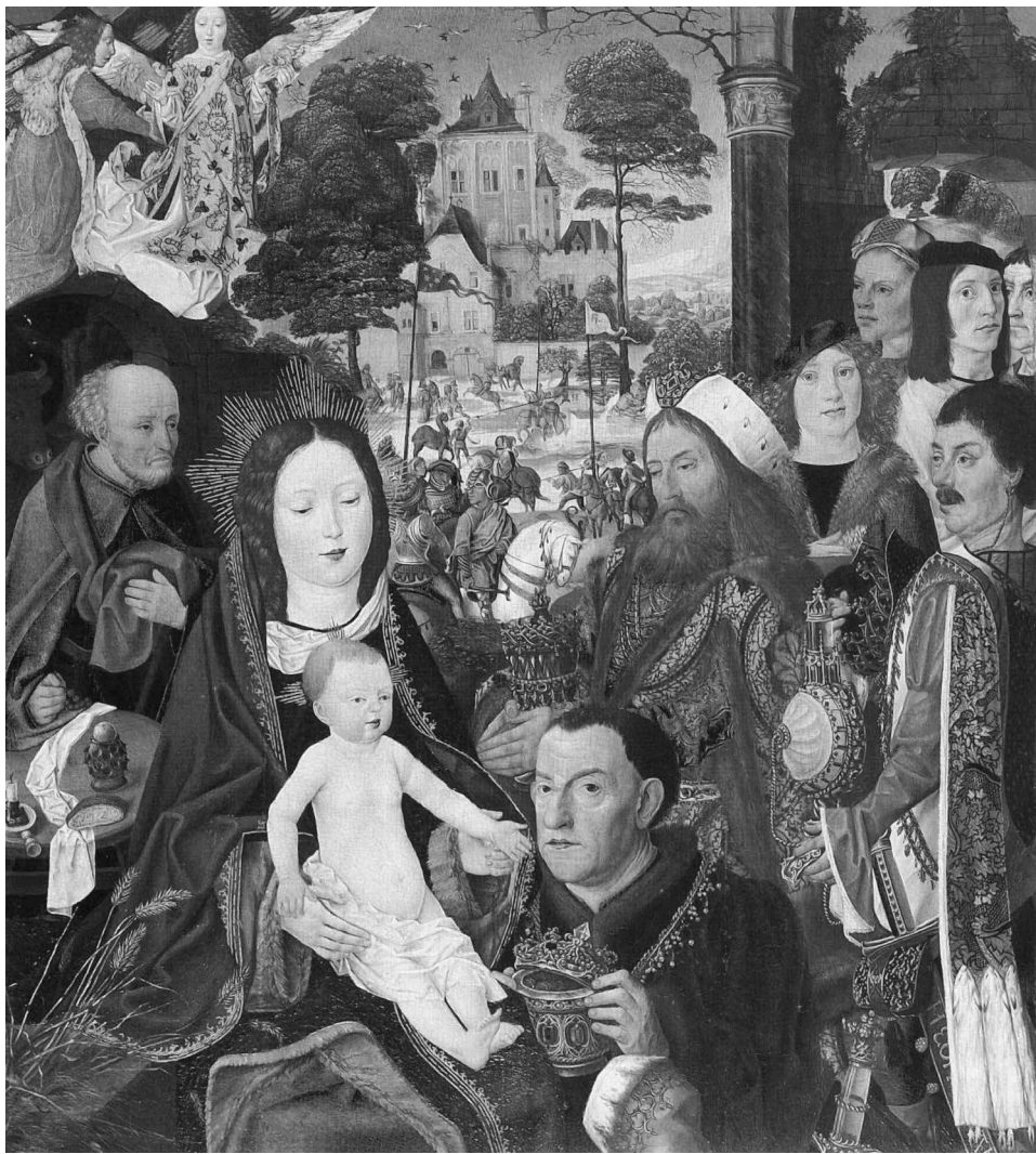
Figure 5: Maître de l'Autel d'Aix-la-Chapelle, Adoration des Mages, vers 1500, huile sur panneau de chêne, 69 × 61 cm, Bonn, Rheinisches Landesmuseum.