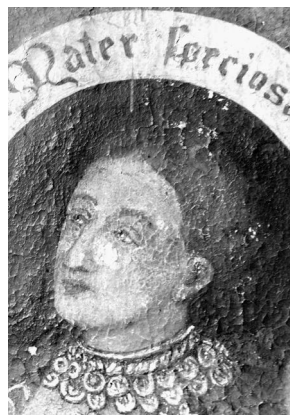
Figures 9a et 9b: Anonyme, Adolphe I er, comte de Cleves, et Adolphe II, comte puis duc de Cleves, en prière, vers 1420-1430, peinture sur enduit, anciennement dans le chœur de la Stiftskirche (St. Mariae Himmelfahrt) de Cleves.