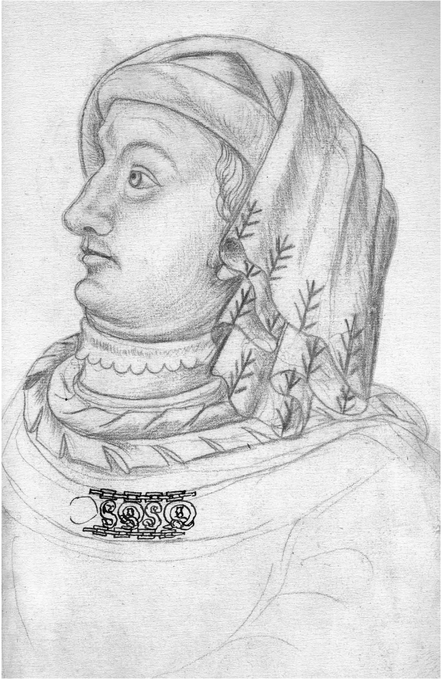
Figure 4: Jacques Leboucq (?), Portrait de Jean de Baviere, dit »sans Merci«, 2 de moitié du XVI e siècle, dessin a la sanguine, Arras, Bibliotheque municipale, Ms. 266, f o 30r (© d apres A. Chatelet).