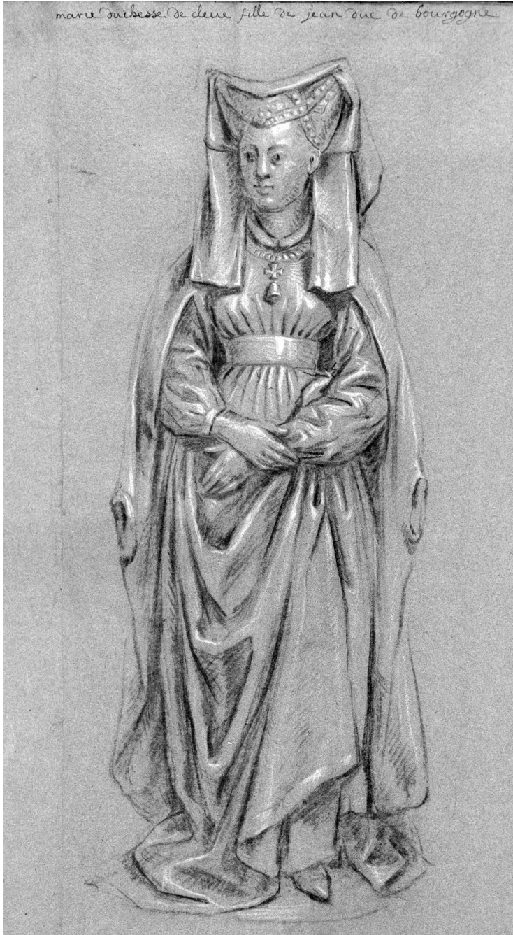
Figure 7: Anonyme, Dessin de la statuette presumee de Marie de Bourgogne (provenant du soubassement du tombeau de Louis de Male, anciennement a Lille), XVIII e siecle, pierre noire et rehauts de blanc sur papier bleu, Lille, Bibliotheque municipale, Ms. 852, f o 5r.