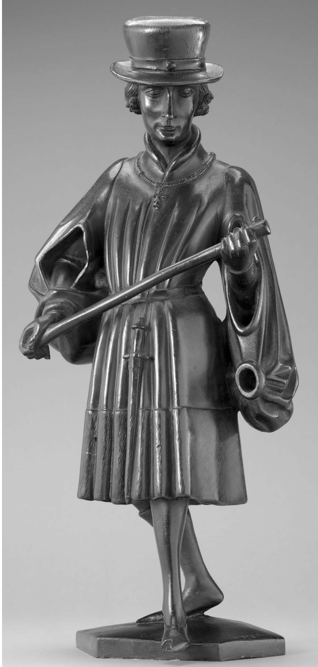
Figure 3: Jan Borman (?) (sculpteur) et Renier van Thienen (?), Statuette du soubassement du tombeau d'Isabelle de Bourbon, anciennement à Saint-Michel d'Anvers: Albert de Bavière?, bronze, Amsterdam, Rijksmuseum.