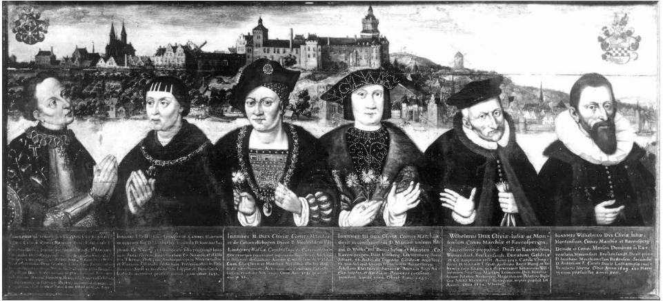
Figure 10: Anonyme, Les six ducs de la Maison de Cleves, vers 1650, huile sur panneau, 62,5 × 138 cm, Cleves, Städtisches Museum Haus Koekkoek.