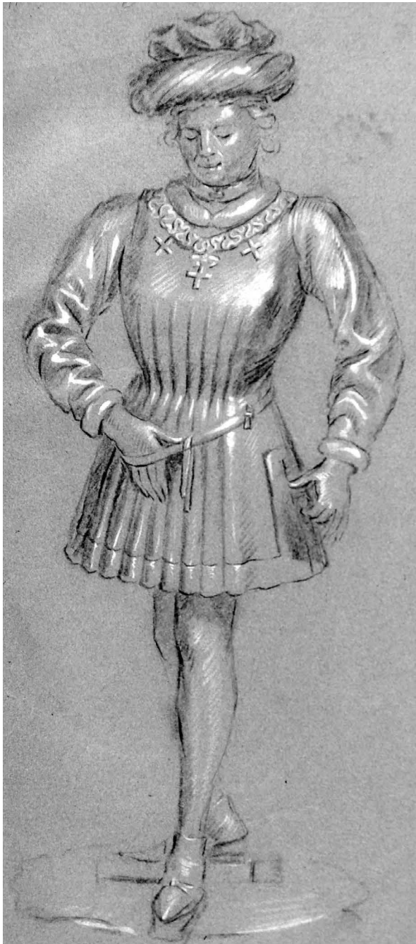
Figure 8: Anonyme, Dessin de la statuette de Jean de Cleves (provenant du soubassement du tombeau de Louis de Male, anciennement à Lille), XVIII e siècle, pierre noire et rehauts de blanc sur papier bleu, Lille, Bibliothèque municipale, Ms. 852, f o 11r.