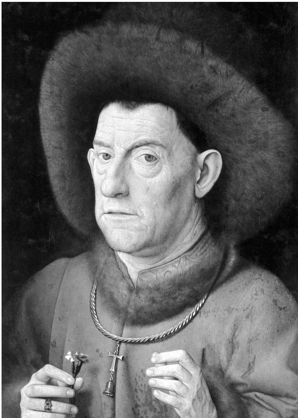
Figure 1: Anonyme, Portrait d homme age dit l Homme à l'œillet (d apres un original de Jean Van Eyck), fin du XV e siecle, huile sur panneau de chene, 41,5 × 31,5 cm, Berlin, Staatliche Museen, Gemäldegalerie (© Bruxelles, KIK-IRPA).