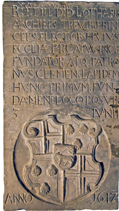
1 Trier, Viehmarktplatz. Gründungsinschrift der Kapuzinerkirche von 1617. Marmor.

Durch die Wahrnehmung denkmalpflegerischer Fachaufgaben fördert das Rheinische Landesmuseum Trier als „grabendes Museum“ nahezu täglich archäologische Bodenfunde aus dem Stadtgebiet von Trier und der Region ans Tageslicht, bewahrt sie damit vor baubedingter Zerstörung und sichert ihren Urkundencharakter durch möglichst umfassende Dokumentation der Fundumstände als Grundlage für ihre wissenschaftliche Erforschung.