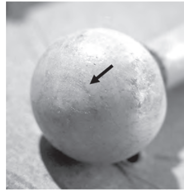
4 Drechselspuren an Nr. 80.