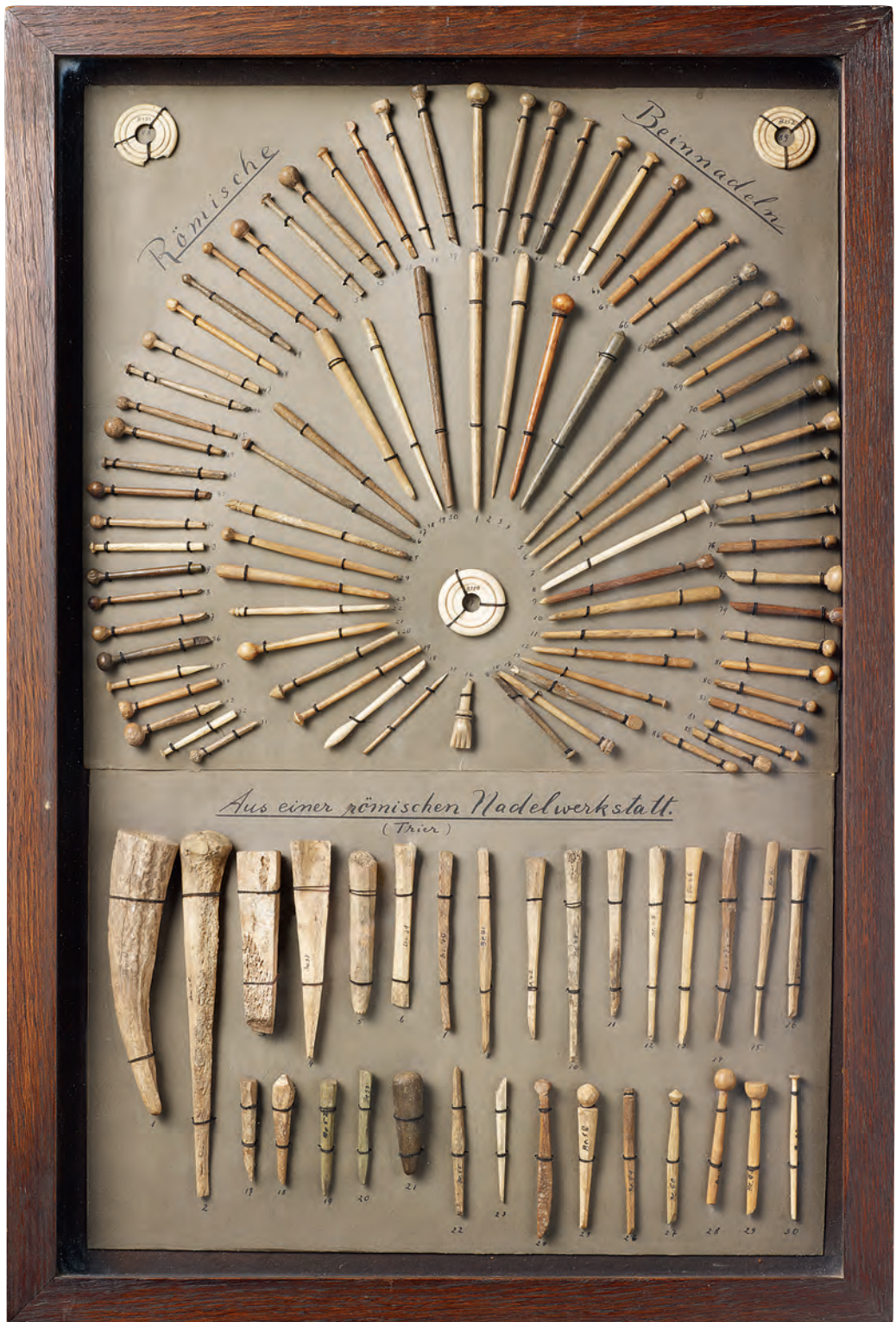
1 Tafel mit römischen Beinartefakten aus Trier. Düsseldorf, Stadtmuseum, Inv. A 6014.