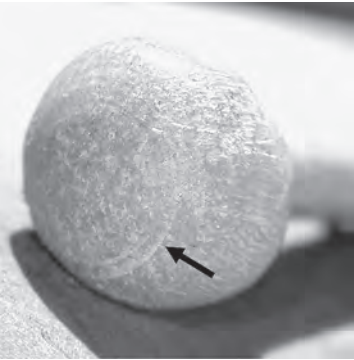
Drechselspuren an Nr. 47.