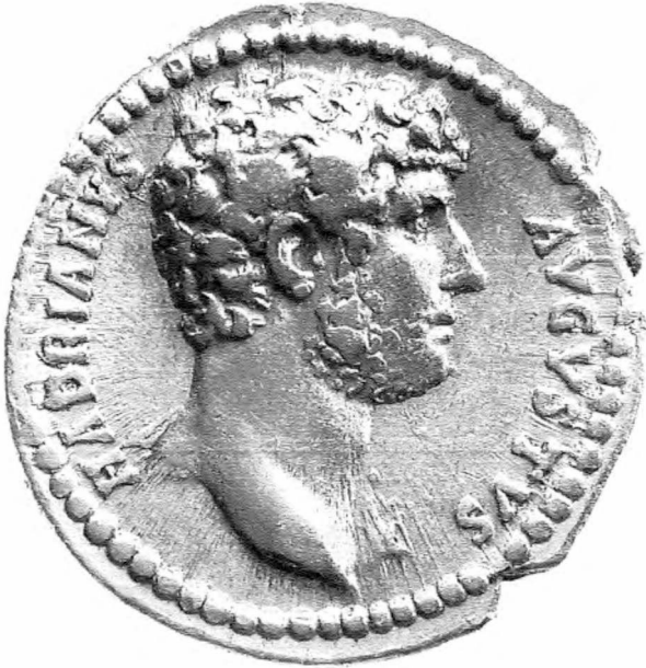
Aureus des Hadrian, zwischen 134 und 138 n. Chr. auf seine Adoptiveltern Trajan und Plotina in Rom geprägt. Variante zu RIC 232 A, möglicherweise stempelgleich mit einem Aureus aus Zagreb (vgl. BMC S. 297), M. ca. 4,5:1.