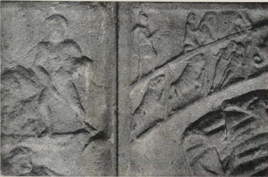
Abb. 1. Ausschnitt aus dem Mithrasstein des Mithreum I von Heddernheim. M. 1:5.

Auf dem bekannten großen Mithrasstein aus dem Mithreum I von Heddernheim 1) ist auf der linken Seite des Rahmens die Szene über dem Okeanos bisher nicht gedeutet 2) (Abb. 1): Mit weit gespanntem Schritt stürmt eine breitschultrige, muskulöse nackte Gestalt nach links. Der Kopf ist mächtig und hat starkes Haar und starken Bart. Über dem linken Unterarm trägt der