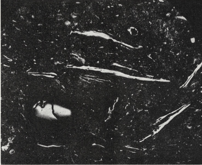
Abb. 1. Querschnitt der Topscherbe: Schwarze Grundmasse: eisenschüssiger Ton. Helle runde Körner: Quarz. Weiße lange Leisten: Querschnitte von Graphitplättchen.