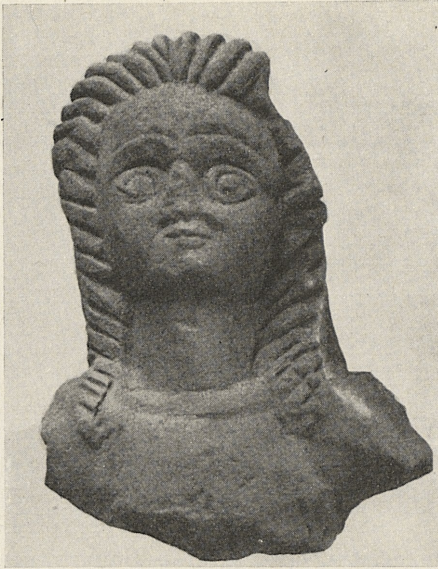
Abb. 3. Weibliches Köpfchen aus Grünsandstein. M. 1:2.