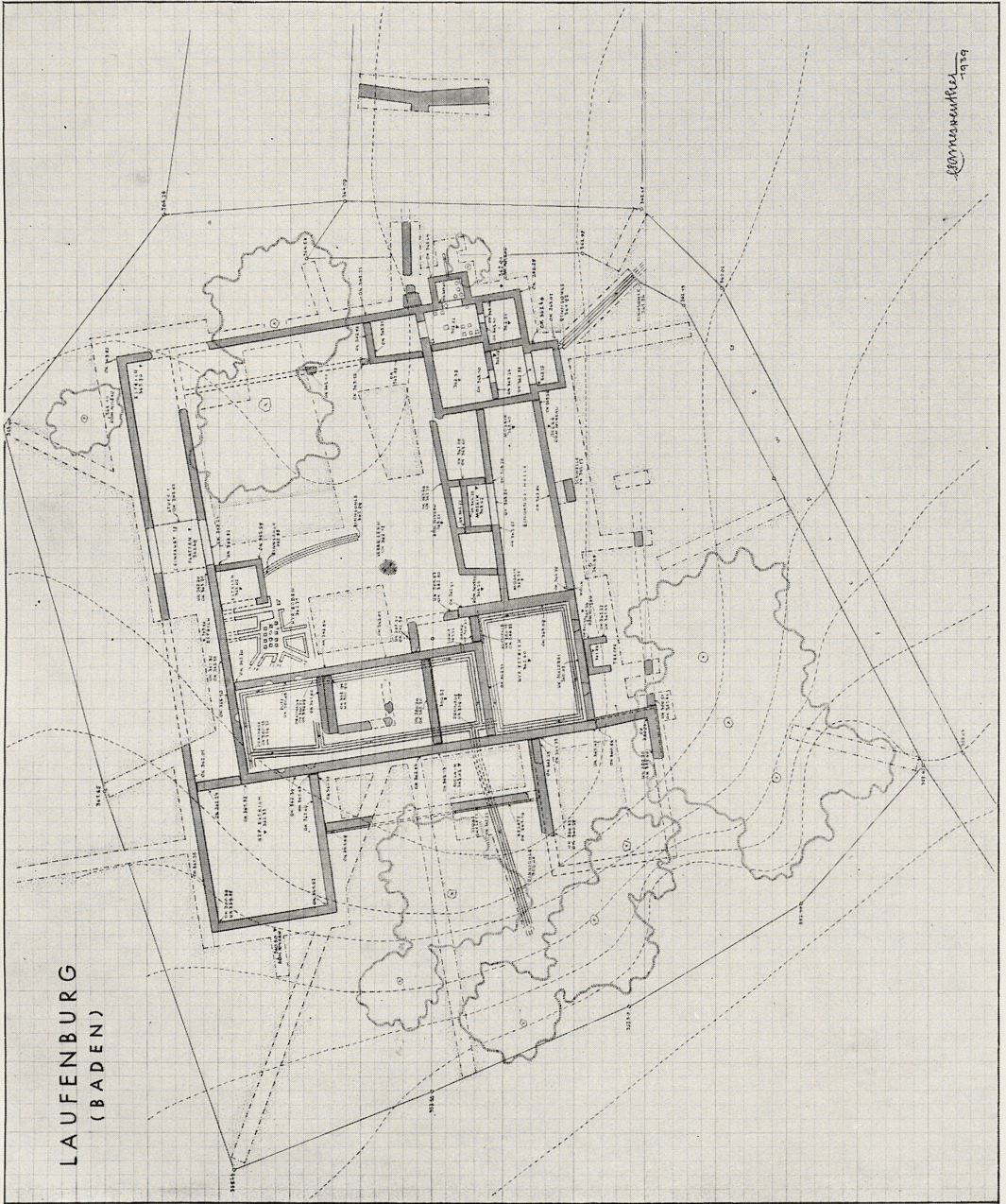
Grabungsplan des röm. Gutshofes bei Laufenburg (Baden) nach dem Stand vom August 1939. M. 1:500.