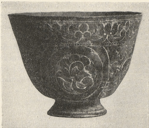
Abb. 1. Metalltasse aus Lom. M. 1:1.