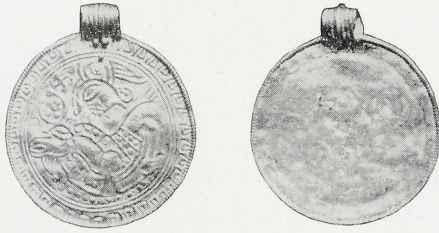
Abb. 2. Brakteat von Meckenheim (Rheinpfalz). Vorder- und Rückseite. M. etwa 1:1.