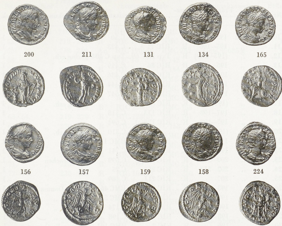
Abb. 1. Denare des Alexander Severus aus dem Fund von Gunzenhausen. M. 1:1.

Im einzelnen enthielt der nachstehend inventarisierte Schatz folgende Typen (von denen die mit einem * versehenen Münzen in Abb. 1 wiedergegeben sind):