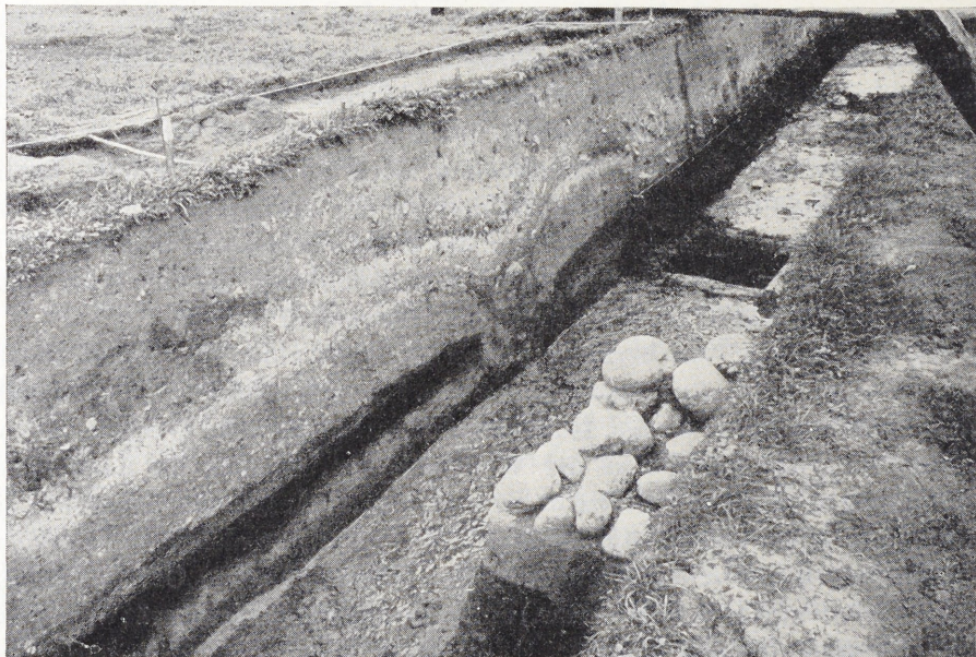
Abb. 2. Blick auf die Nordwand des Suchgrabens östlich des Kirchenfundamentes (Grabung 1949).

Die untere slawische Siedlungsschicht enthielt im Verhältnis zu den beiden darüberliegenden nur wenige handgemachte, grob gearbeitete Scherben, die von