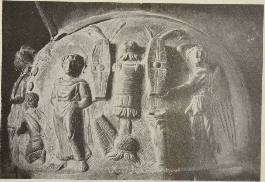
Abb. 3. Linke Seite des Helms.