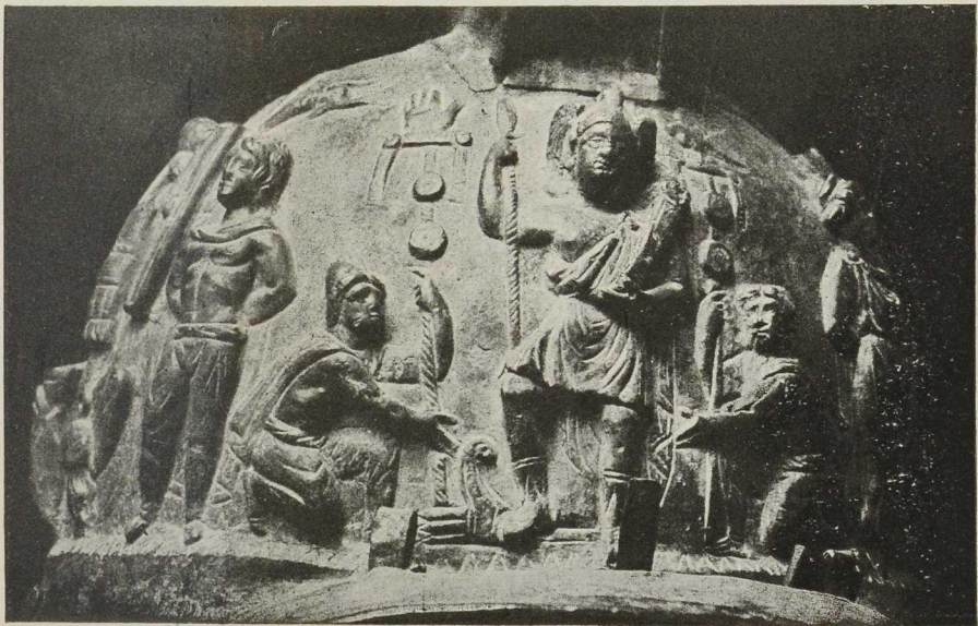
Abb. 1. Mittelbild des Gladiatorenhelms aus Pompeji.