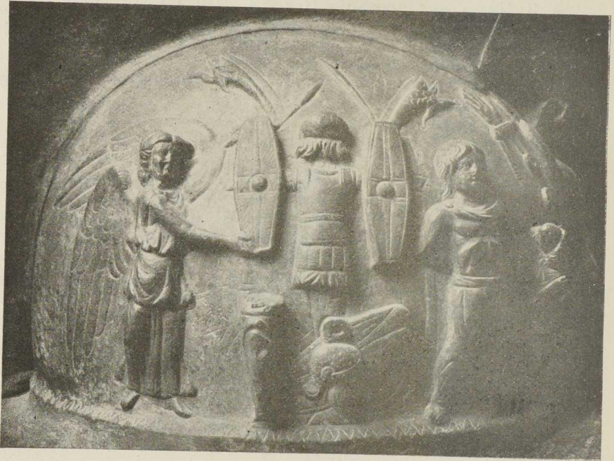
Abb. 2. Rechte Seite des Helms.