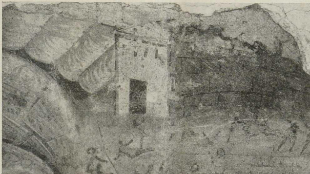
Abb. 2. Wandgemälde aus Pompeji.