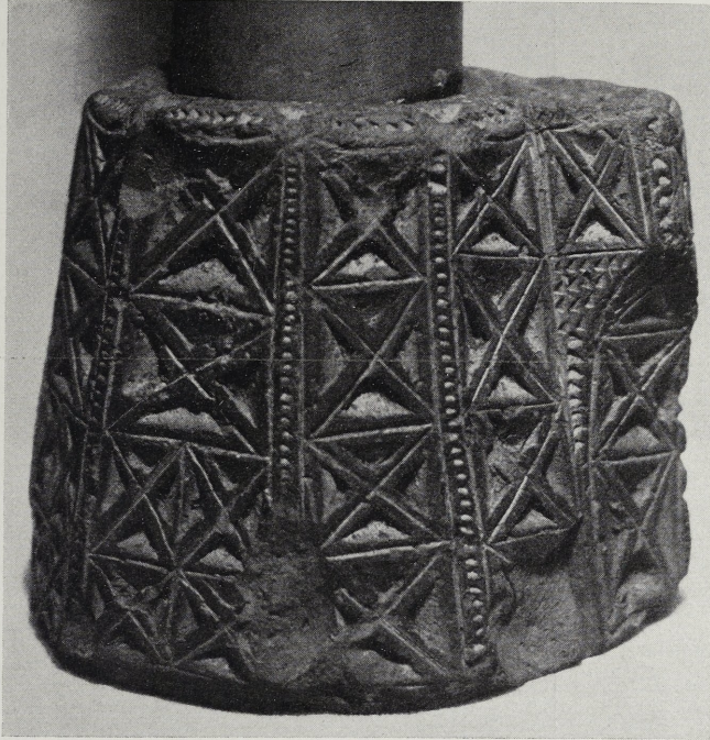
Abb. 2. Lichtstock von Nördlingen (?). 3:4.

württembergischen Gruppe teilt nur das Stück unbekanntes Fundorts (Veeck Taf. 19 A, 3) diese Eigentümlichkeit; doch ist der Ansatz hier abgebrochen, so daß der neue Fund den älteren in erwünschter Weise erläutert. Übrigens befindet sich am Rande des Lichtstocks von Lorch ein kleines Grübchen, das wohl dem gleichen Zweck wie der sockelartige Ansatz gedient hat. Die Proportionen des Nördlinger Stückes geben ihm eine weniger gedrungene Form, als sie z. B. den Exemplaren Veeck Taf. 19 A, 1. 4—6 eigen ist; der Gesamteindruck legt eine Zuweisung an die Zeit der Gotik nahe. In dieser Hinsicht erscheint dem neuen Stück der Stuttgarter Lichtstock Veeck Taf. 19 A, 3 am nächsten verwandt. Bereits vorausgreifend sei auf den Brandenburger Lichtstock von 1534 (Abb. 3 und 4) verwiesen, dessen Ornamentik genau dasselbe Muster, aber in weniger sorgfältiger Ausführung zeigt. In Berücksichtigung dieser Umstände ist es wahrscheinlich, daß der Typ Abb. 2 dem 14./15. Jahrhundert angehört.