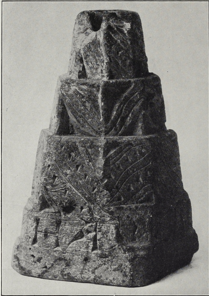
Abb. 3. Lichtstock von Brandenburg a. H. 3:4.

stimmen neuzeitliche Streichholzbehälter aus Bückeberg ('Riekstickerfätter') in Form und Ornament eng überein 11 . Das bodenständige Töpferhandwerk hat in diesem Falle die einfache Gebrauchsform mit ihrer volkstümlichen Ornamentik bis in das 19. Jahrhundert bewahrt. In Berlin sind noch vor wenigen Jahrzehnten bei Illuminationen Leuchter verwandter Form (Pyramidenstümpfe, auch Kegelstümpfe) aus Gips gebräuchlich gewesen. Dieser Hinweis wird G. Mirow verdankt, der vor einigen Jahren einen sehr wichtigen Beitrag zur Lichtstockfrage gegeben hat 12 .