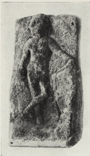
Abb. 2. Apollorelief von Niedernau. M. 1:8.

trennte. Aber gänzlich unsicher bleibt, ob in der Fortsetzung nach links dargestellt war der hängende Marsyas, in welchem Fall der liegenden Nymphe der Sklave entsprochen hätte, oder der flötenspielende Marsyas, wofür man an das Bierbacher Denkmal mit seinem großen Götterverein bei Espérandieu V 484 Nr. 4484 erinnern mag. Die Haltung des Apollo ist so zu erklären, daß er entweder, was mir wahrscheinlicher erscheint, der Ausführung des Urteils zuschaut oder sich zum entscheidenden zweiten Gang des Spiels anzuschicken bereit ist.