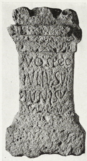
Abb. 1. Vosegus-Altar aus der Pfalz. M. 1:7.