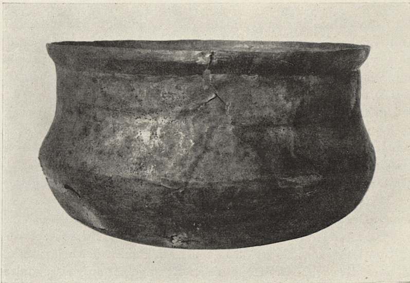
Abb. 1. Bronzekessel vom Angelhof bei Speyer. M. etwa 1:3.

Unter den zahlreichen römischen Bronzegefäßen, die als Baggerfunde aus dem Rhein beim Angelhof etwa 5 km unterhalb von Speyer zutage kamen, befindet sich ein Kessel, der eine eingeritzte Inschrift trägt. Das Gefäß wurde mit weiteren Stücken derselben Fundstelle in der Werkstatt des Zentralmuseums in Mainz restauriert 1 ; bei dieser Gelegenheit wurde die Inschrift entdeckt, die hier mit freundlicher Erlaubnis von F. Sprater veröffentlicht wird. Das Stück befindet sich im Historischen Museum der Pfalz in Speyer.