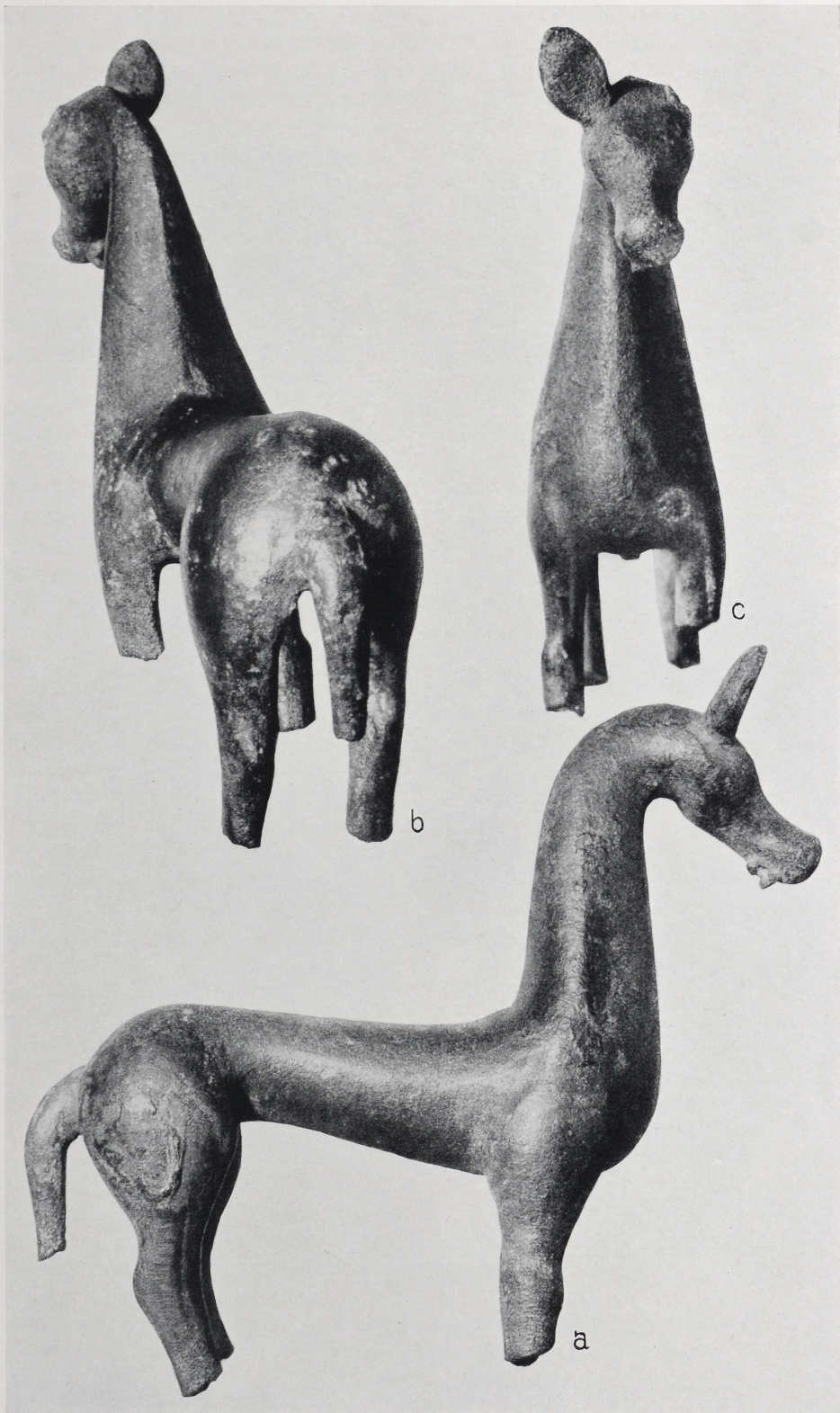
Keltisches Bronzepferdchen von Freisen. 1:1.