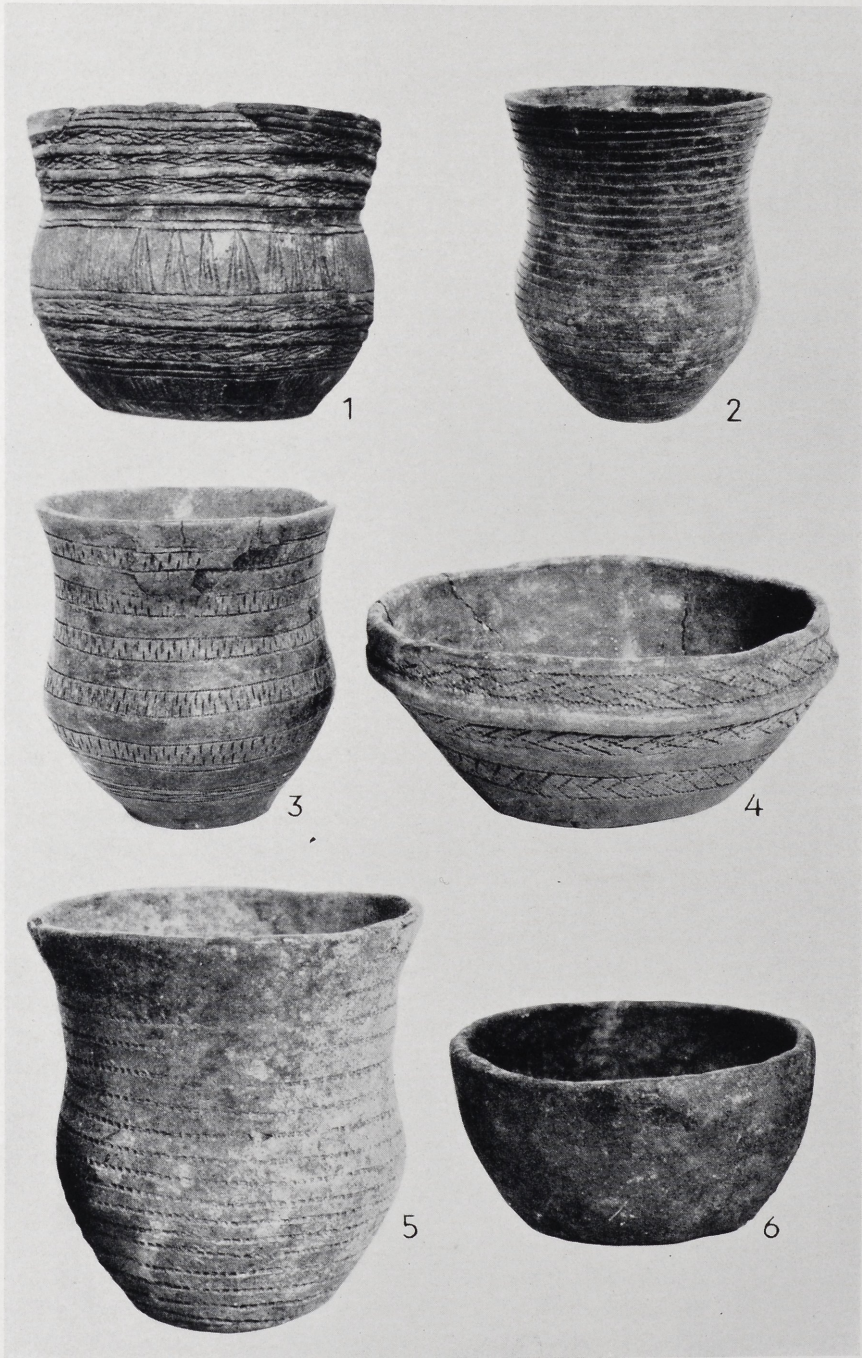
1 Plaidt. 1:4; 2 Mülheim. 1:4; 3-4 und 5-6 Zwei Grabfunde von Mülheim. 1:4 bzw. 2:3. (Vgl. Fundchronik Bonn.)