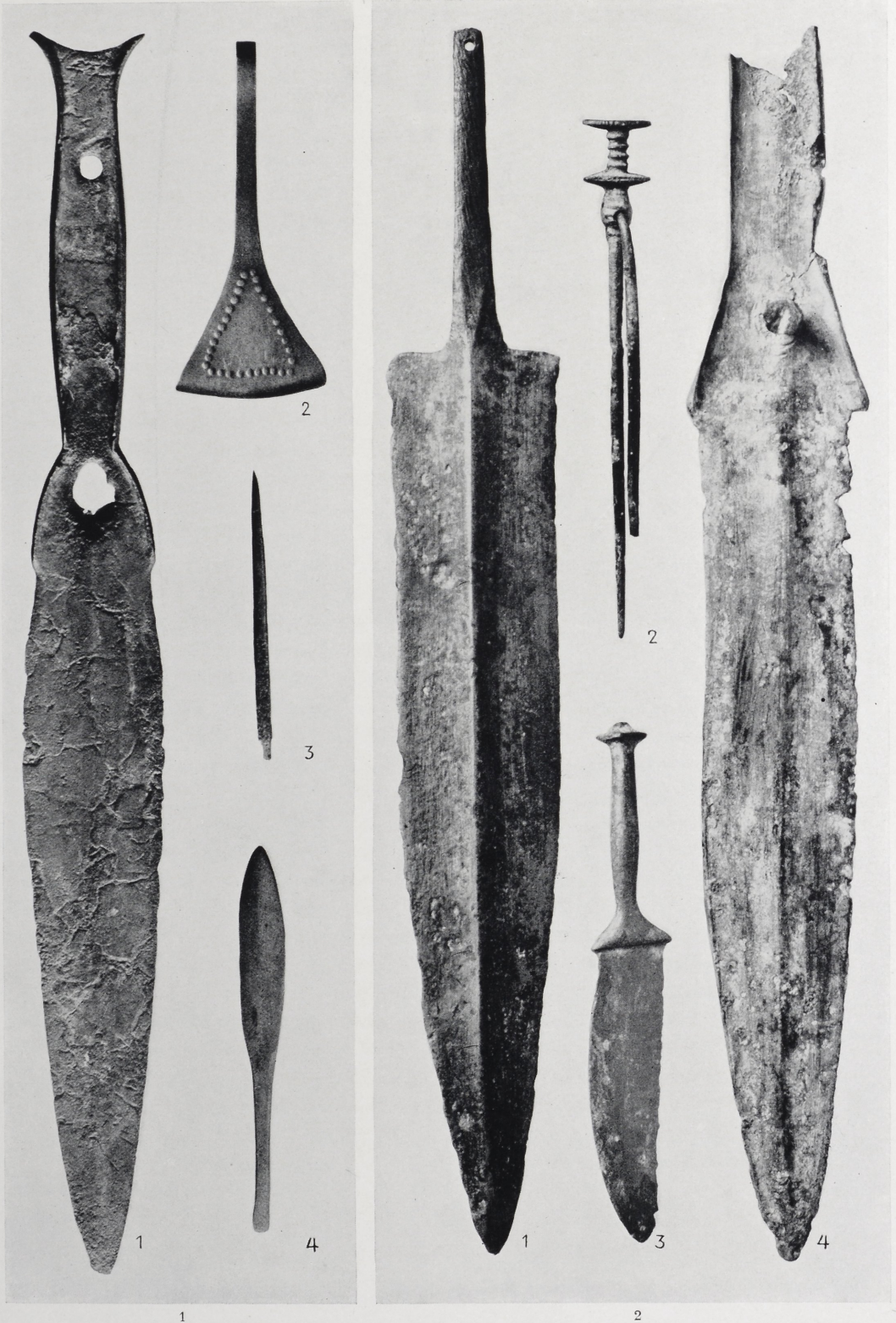
Grabfunde von Wehdel, Kr. Geestemünde (1) und Hovby, Schonen (2). 1:1.