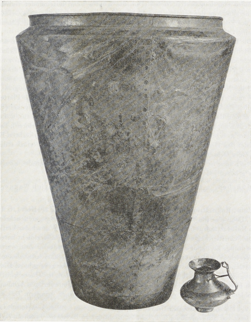
Abb. 1. Au, Ldkr. Aichach. Eimer und Kanne der späten Hallstattzeit. M. etwa 1 : 6.

Hallstattgrabfund von Au, Gem. Rehling, Ldkr. Aichach, Oberbayern. In den Lechfeldwiesen, 600 m sw. von Au, liegt am linken Ufer der Ach, die hier den östlichen Höhenrand des breiten Lechtales begleitet, eine aus 24 meist stark verebneten Hügeln bestehende Grabhügelgruppe. Elf in den 1890er Jahren untersuchte Hügel enthielten