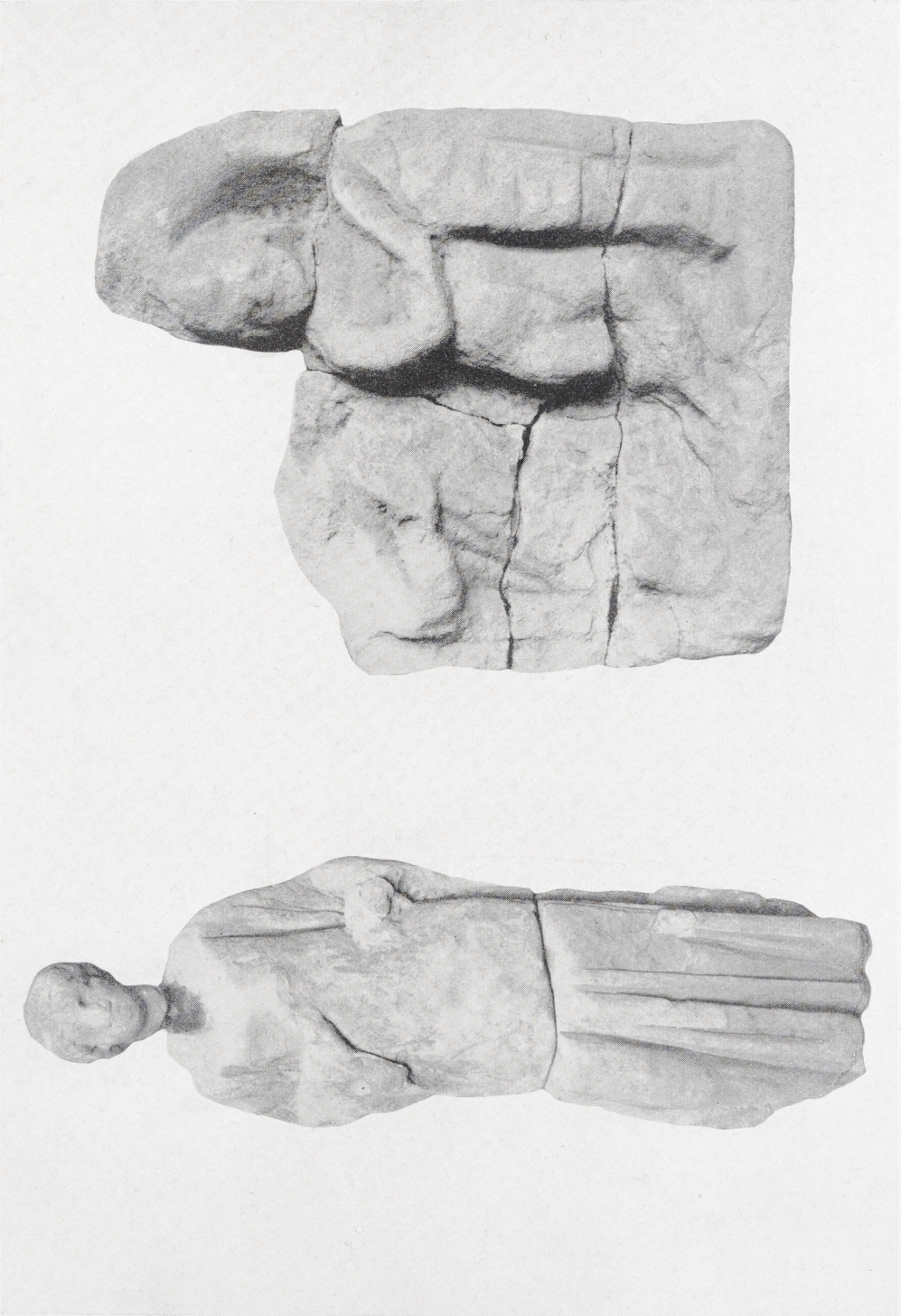
a Aus dem Quellheiligtum von Niedaltdorf (Saargebiet), jetzt im Landesmuseum Trier. a Kultstatue der Quellnymphe. b Votivrelief: Apollo und Quellnymphe. a M. etwa 1:7,5; b M. etwa 1:3.